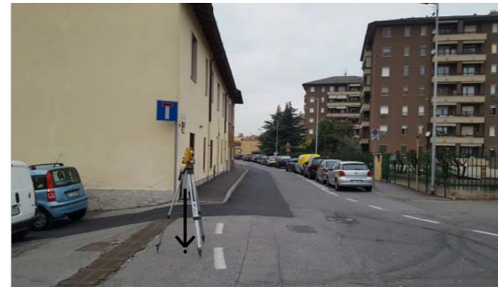
CAPOSALDO 02 - Chiodo metallico