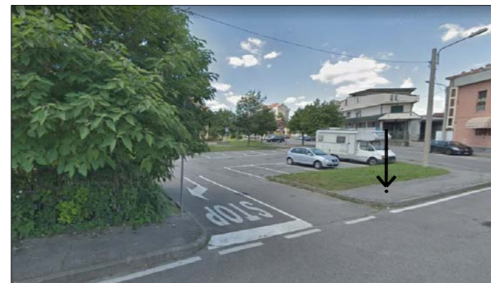
CAPOSALDO 03 - Chiodo metallico