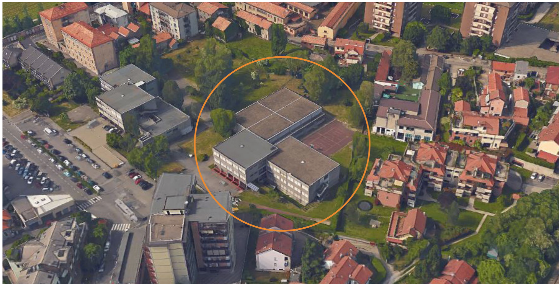
Area di intervento