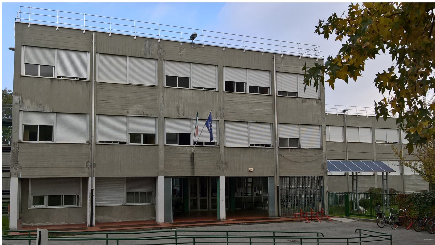
Vista del fronte principale dell'edificio - Stato di fatto