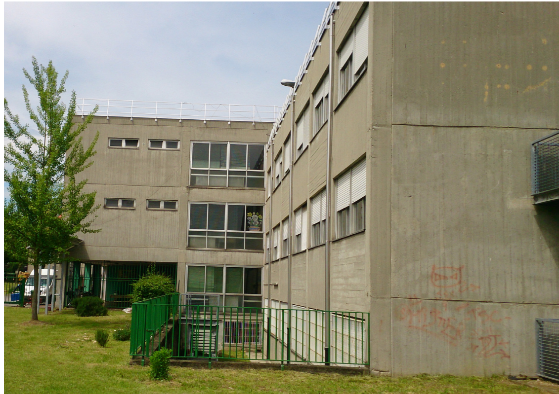
Prospetto sud - est