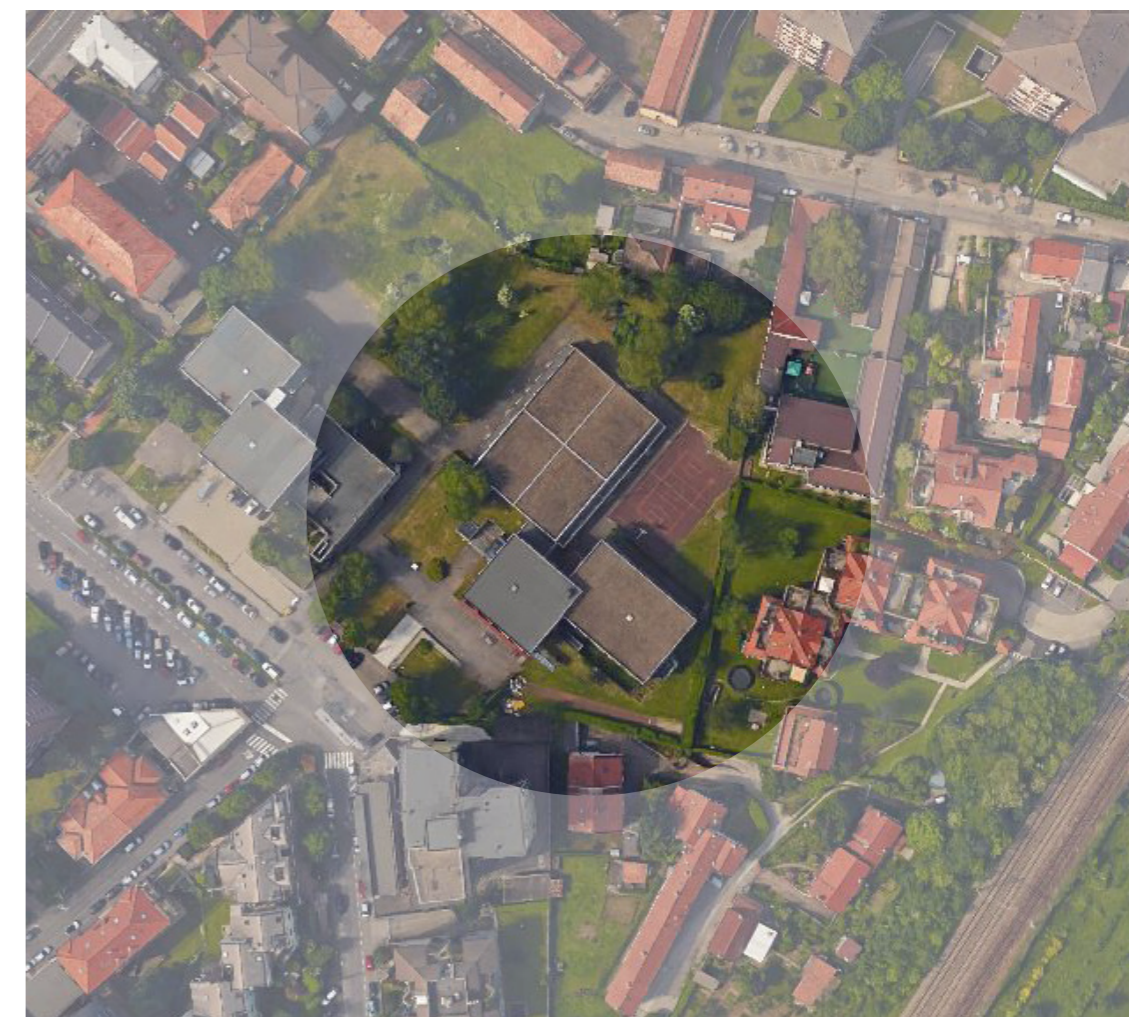
Aerofotogrammetrico dell'area di intervento