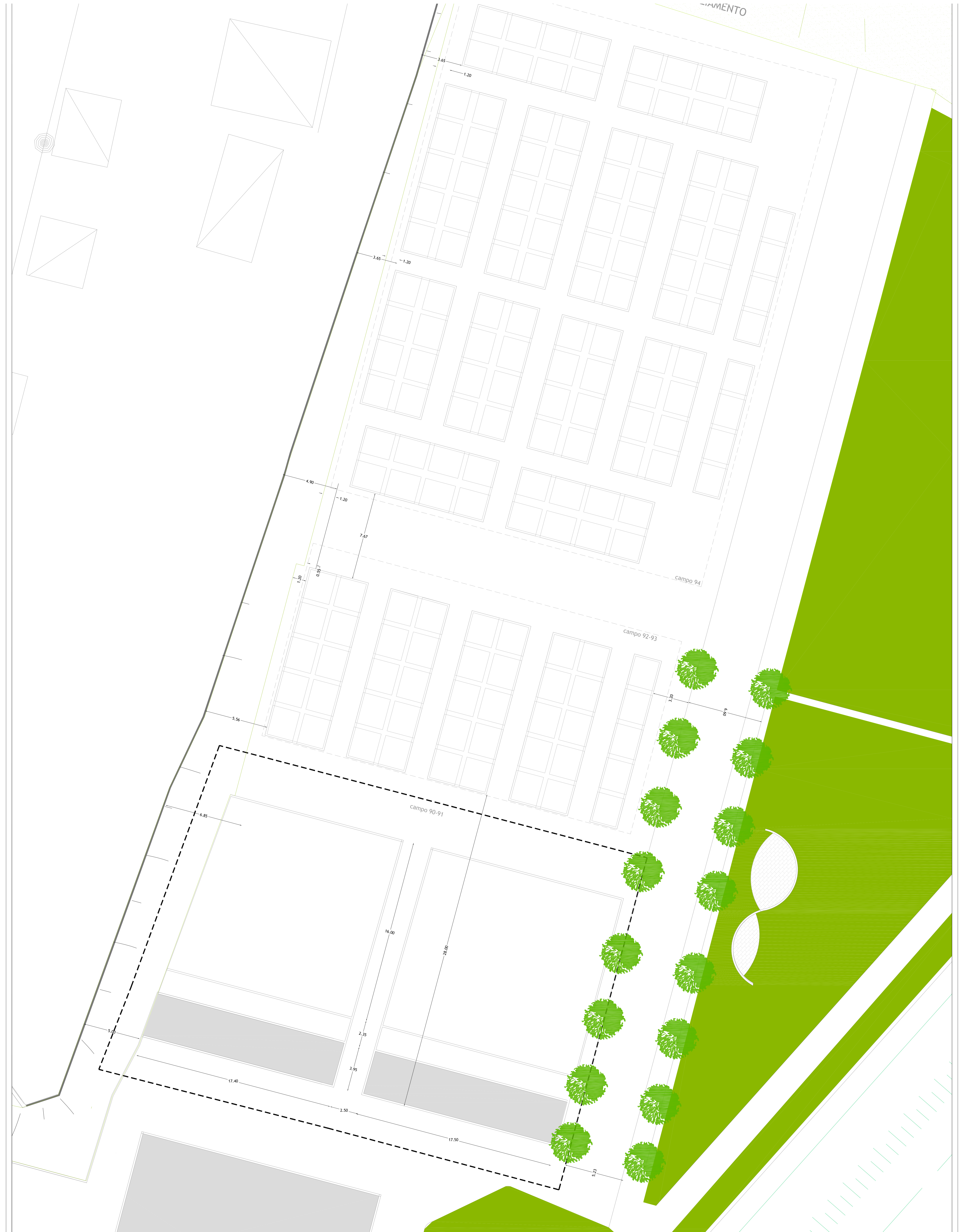
Planimetria del Campo 90-91 scala 1:100