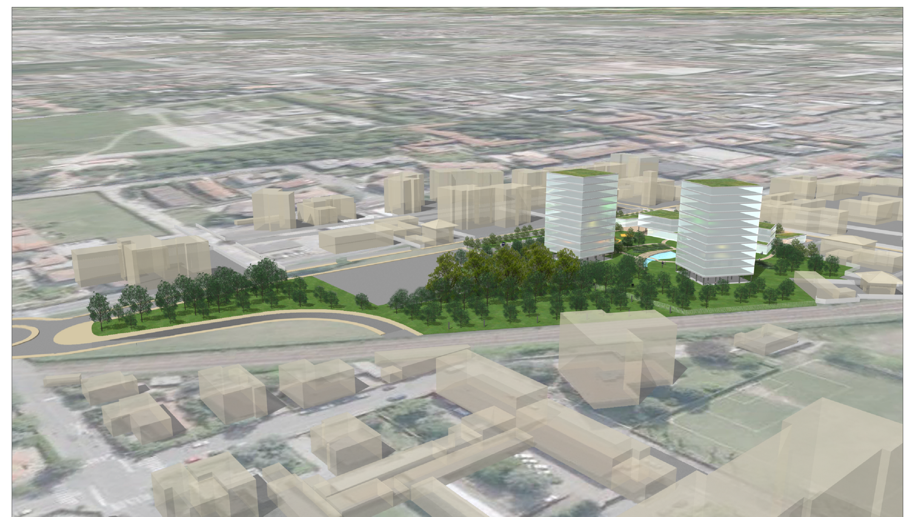
SIMULAZIONE PROSPETTICA BOSCO URBANO - VISTA NORD/OVEST