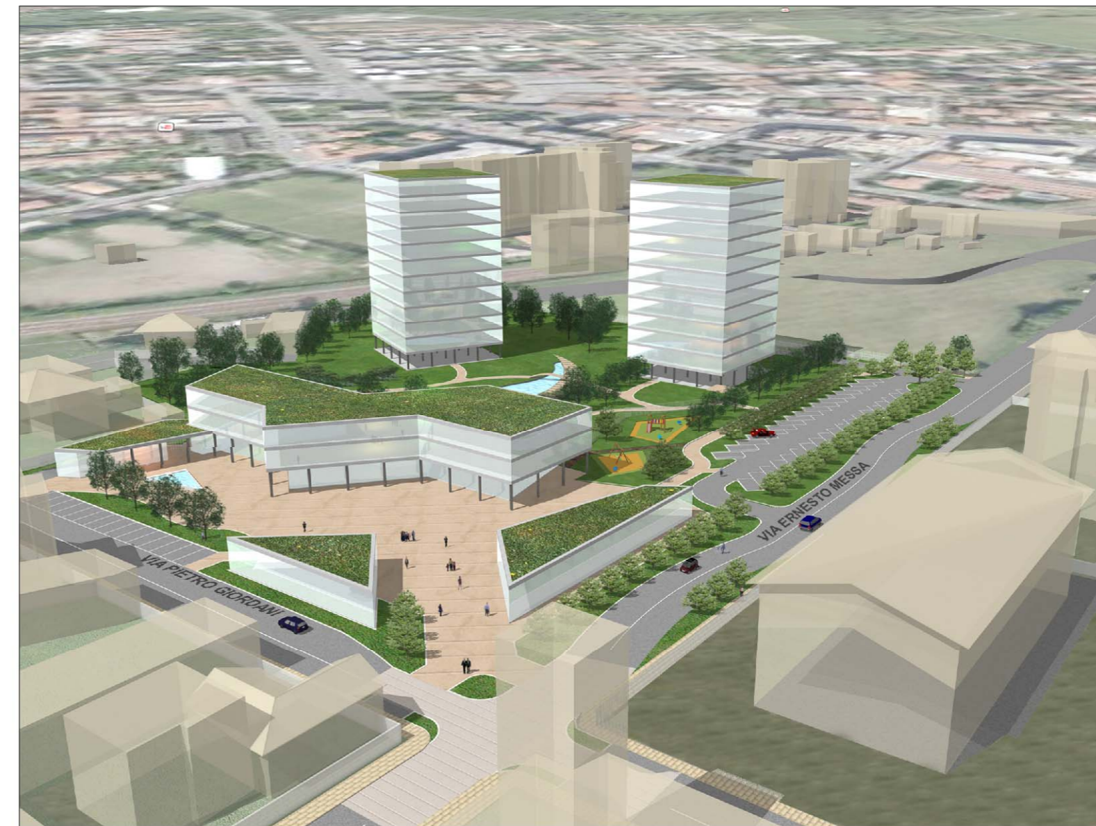
SIMULAZIONE SCHEMATICA 3D - VISTA SUD/EST