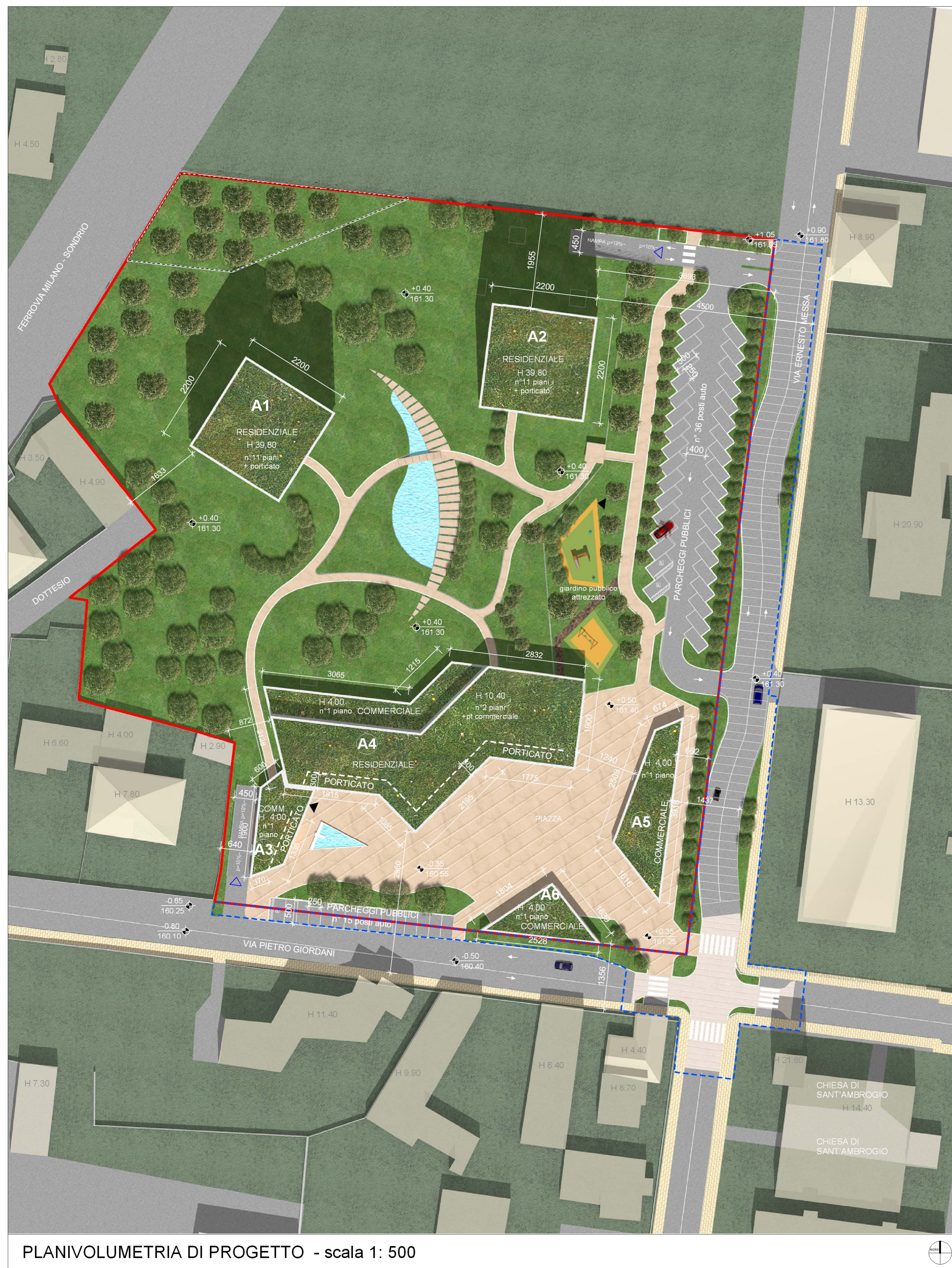
PLANIVOLUMETRIA DI PROGETTO - scala 1: 500