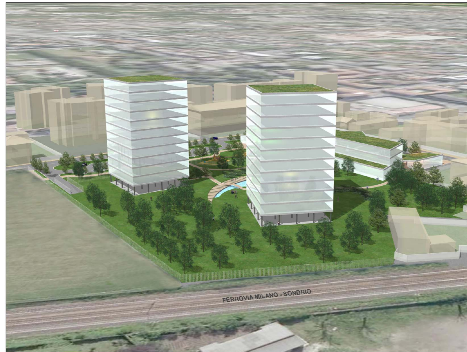
SIMULAZIONE SCHEMATICA 3D - VISTA NORD/OVEST