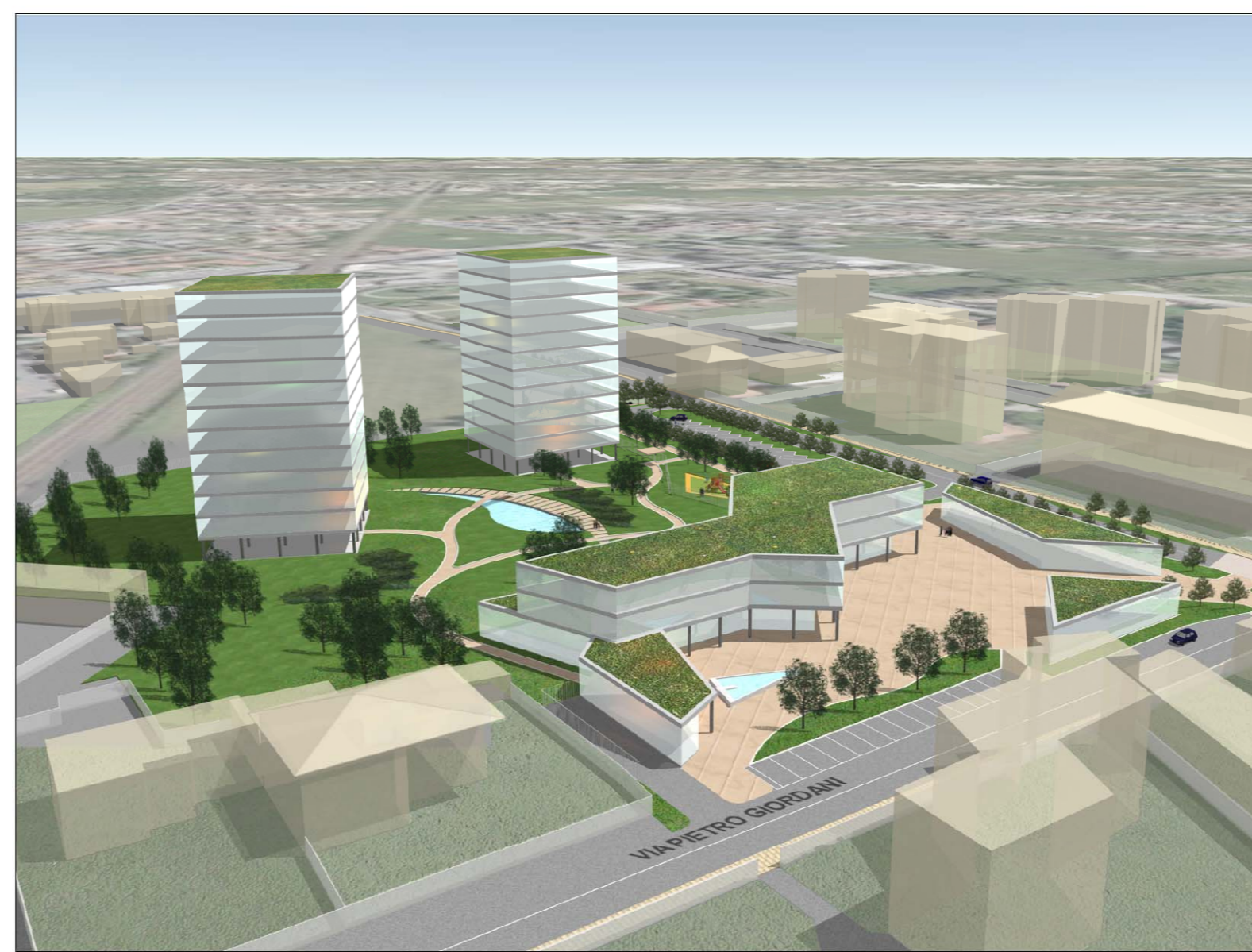
SIMULAZIONE SCHEMATICA 3D - VISTA SUD/OVEST