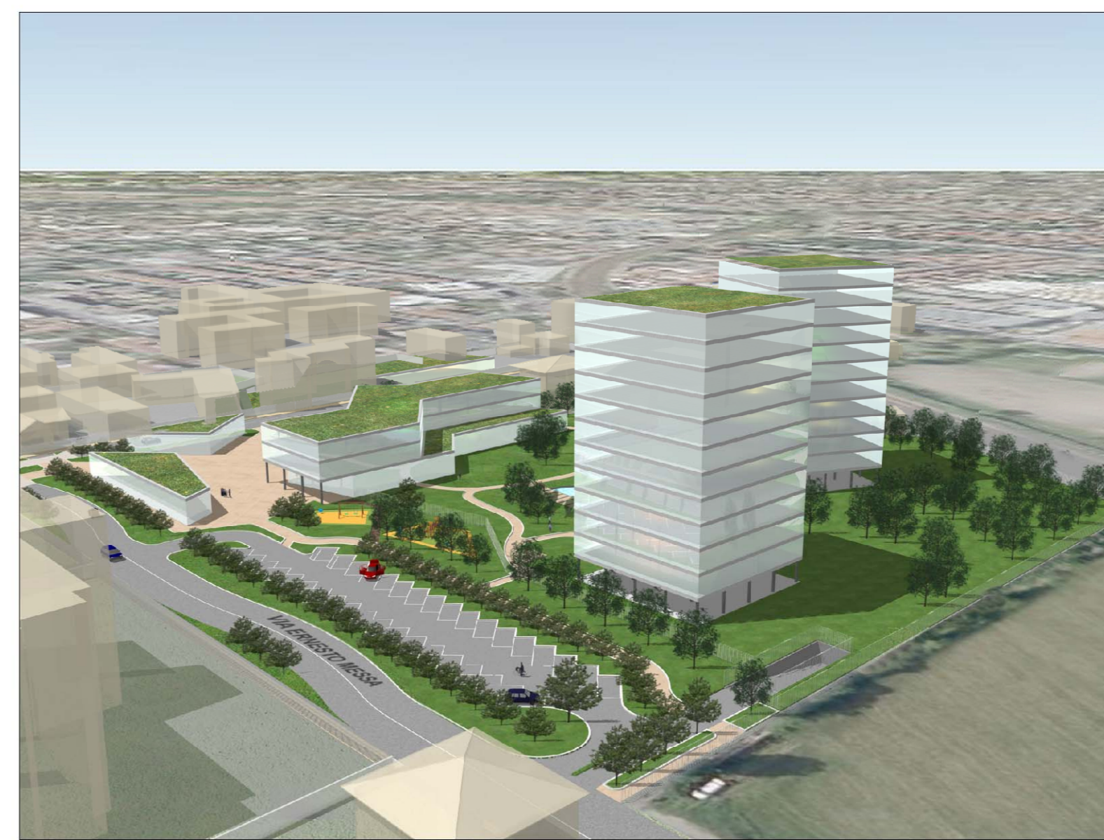
SIMULAZIONE SCHEMATICA 3D - VISTA NORD/EST