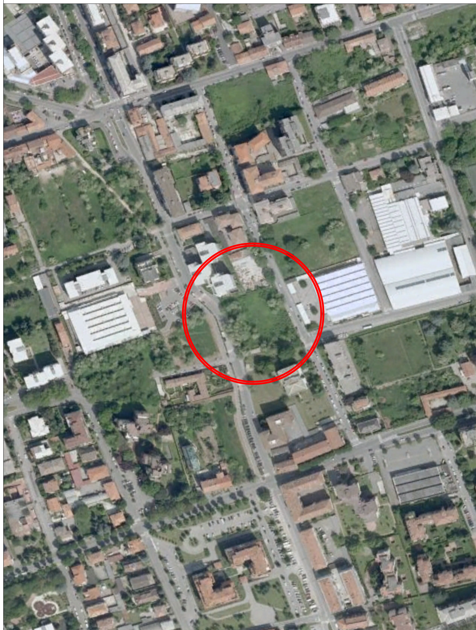
FOTO AEREA LOTTO D'INTERVENTO ESTESA AL TESSUTO URBANO CIRCOSTANTE