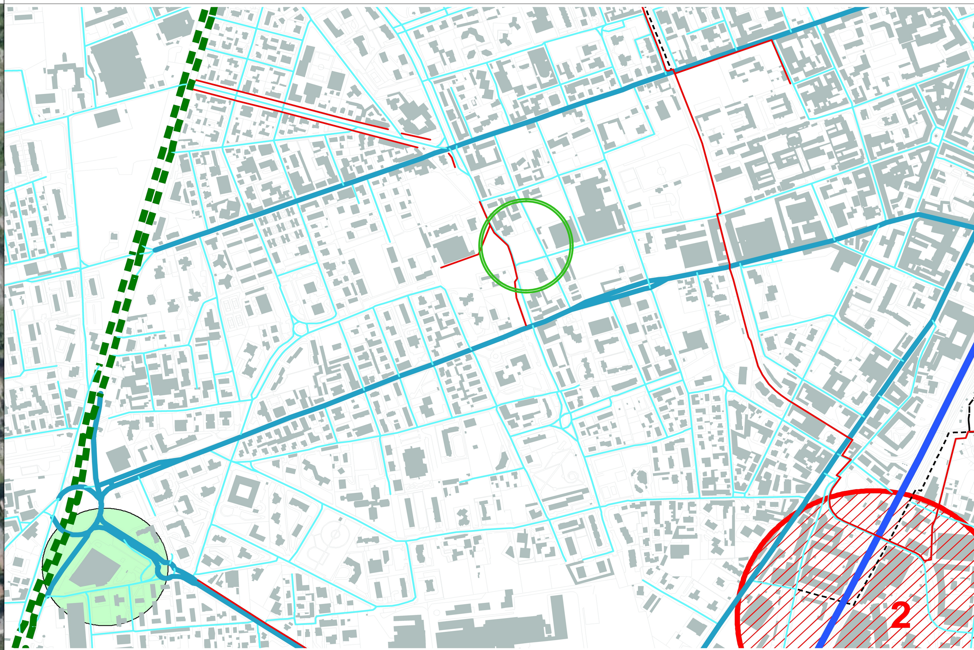
VARIANTE GENERALE AL P.G.T. ADOTTATA - COMUNE DI MONZA - STRALCIO TAV. DP1 - SISTEMA INFRASTRUTTURALE