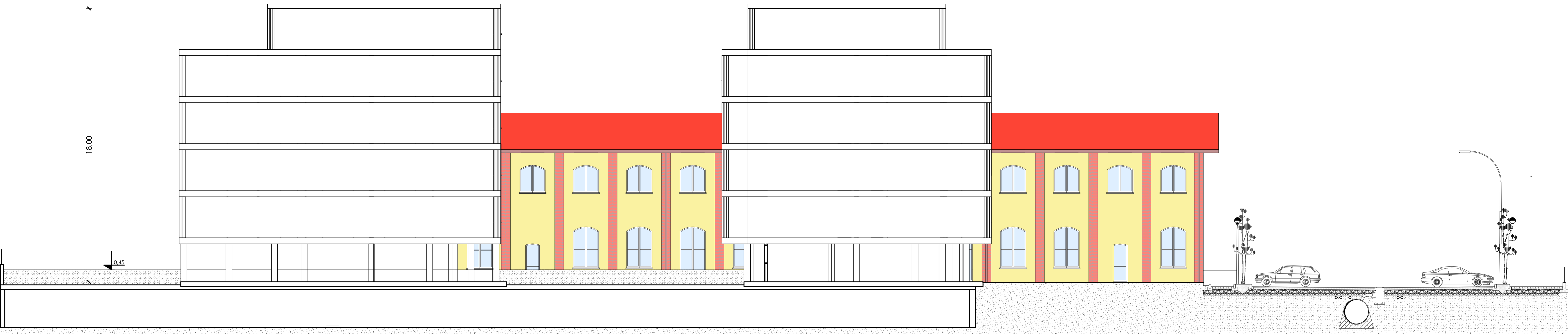
SEZIONE TRASVERSALE Y-Y