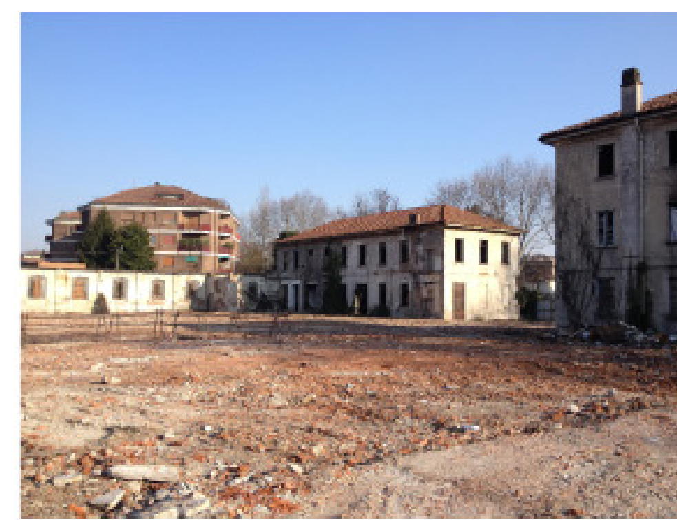
20. vista dall'interno: villa Azzurra, ex casa delle aste e muro di confine su via Donizetti