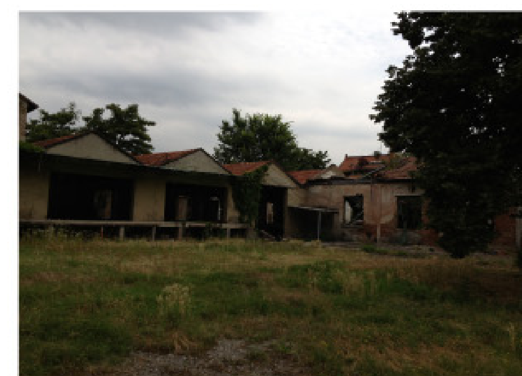
16. vista dall'interno: muro di cinta ovest