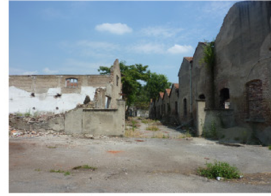
11. via Scarlatti