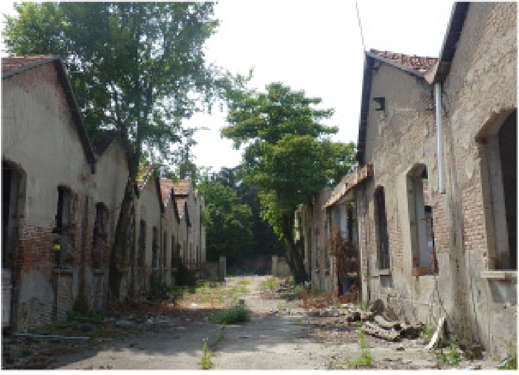
9. Via Donizetti muro di cinta nord est