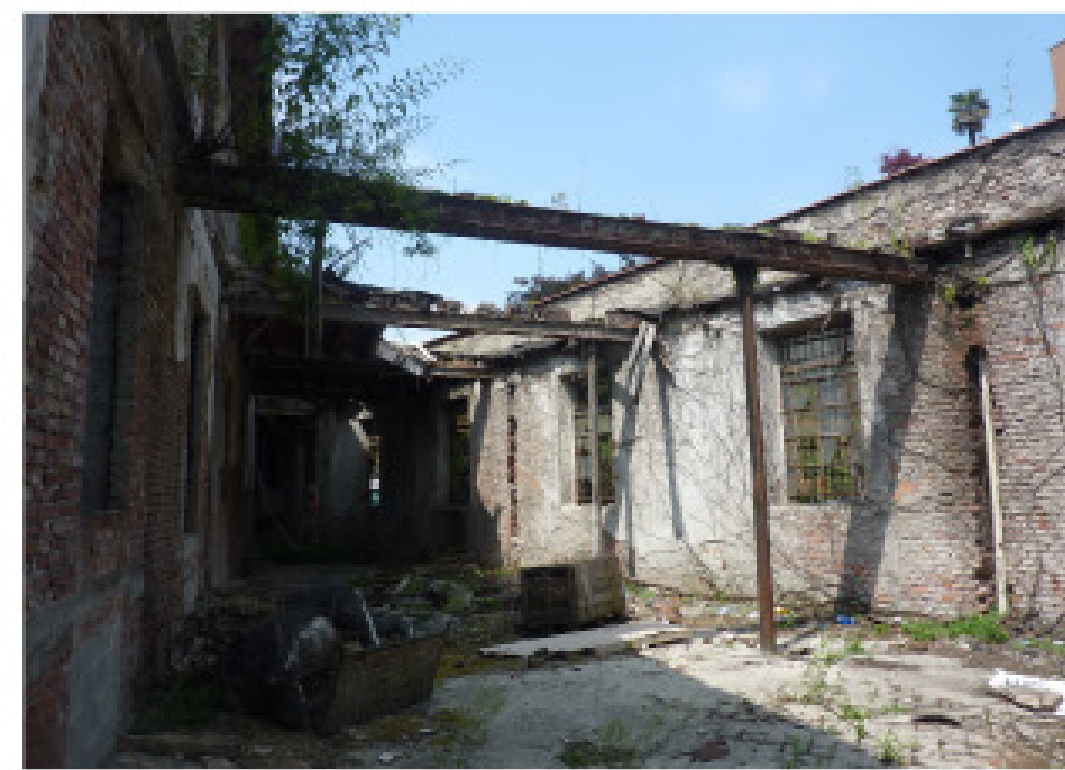
7. Via Donizetti muro di cinta est