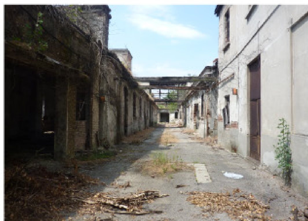
1. Ingresso asse nord sud