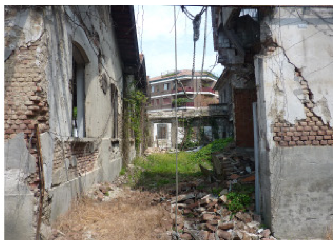
2. Viale Cesare Battisti angolo via Donizetti