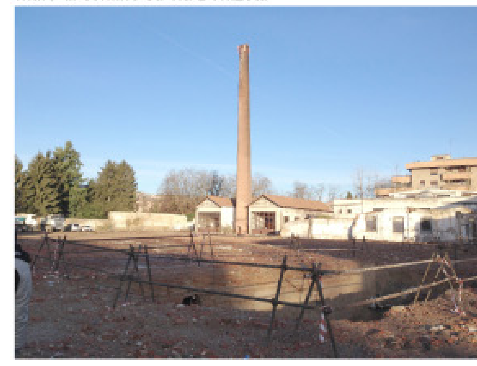
24. vista dall'interno: ciminiera