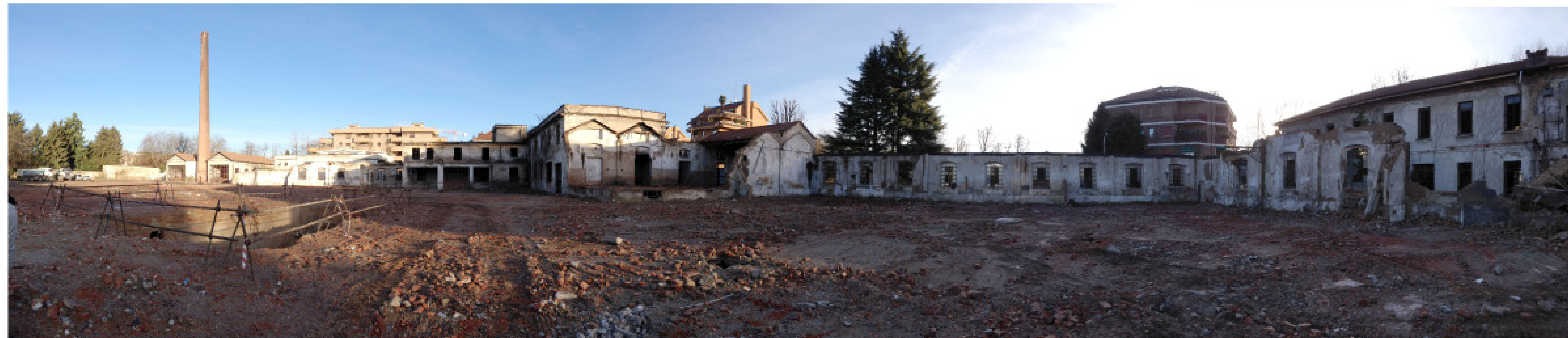
25. vista dall'interno: foto panoramica