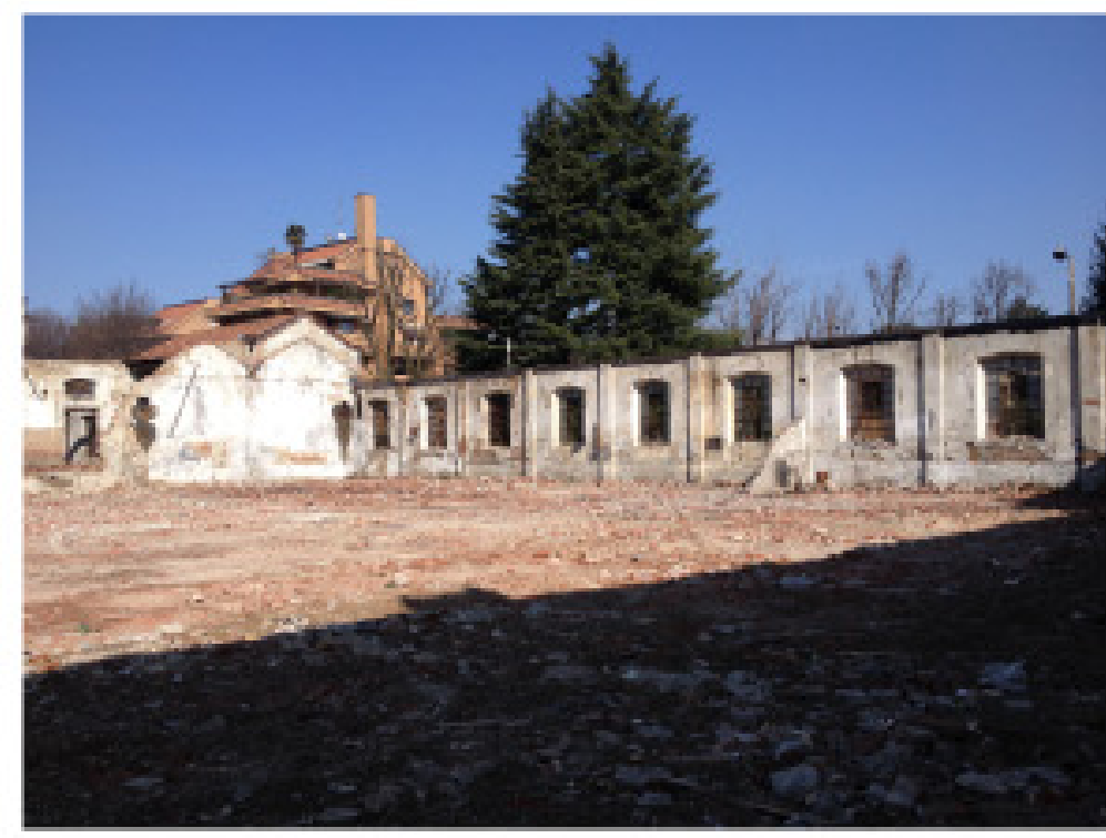
21. vista dall'interno: confine su via Donizetti