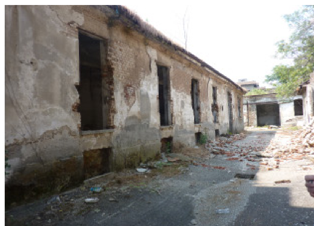
3. Viale Cesare Battisti ex casa delle aste