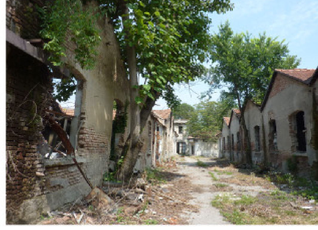
10. Via Donizetti angolo via Scarlatti