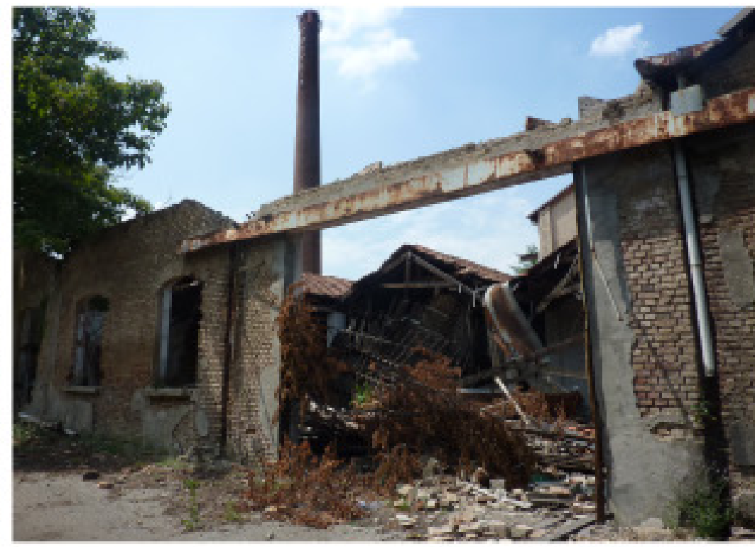
8. Via Donizetti muro di cinta est