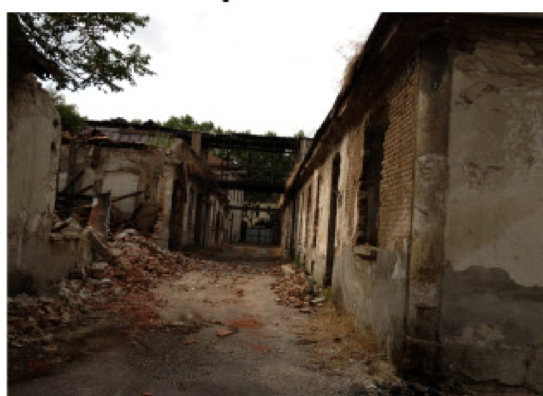
5. Viale Cesare Battisti muro di cinta sud