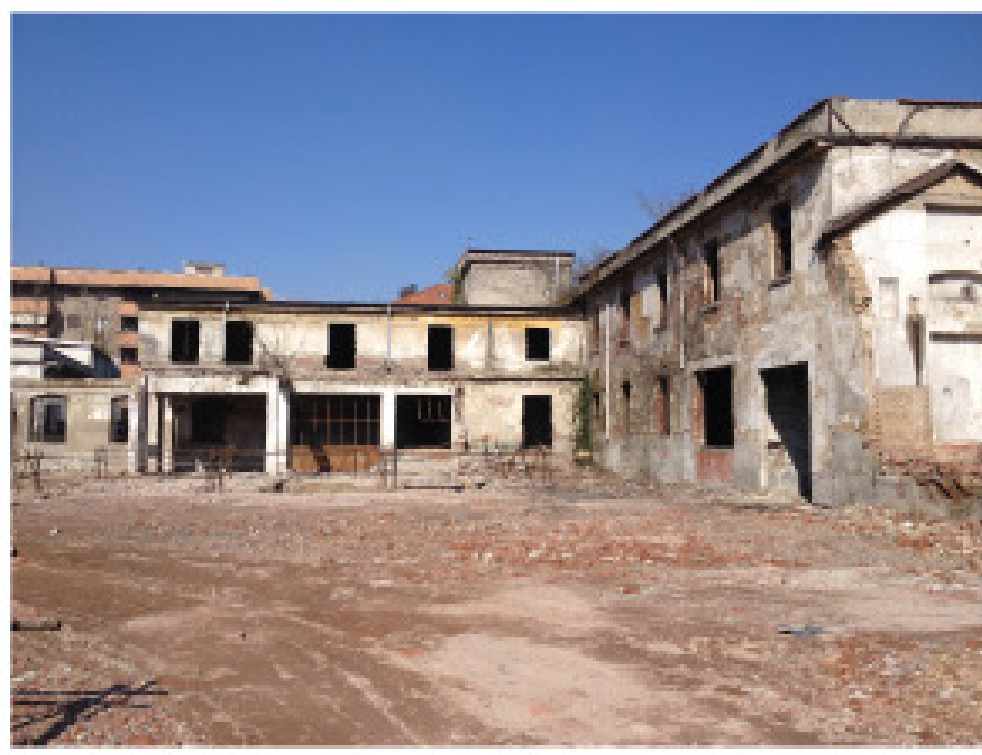
22. vista dall'interno: edifici a nord