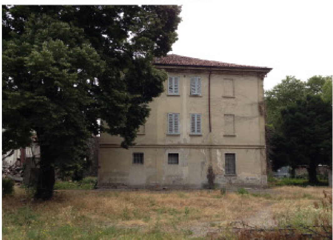
14. vista dall'interno: muro di cinta nord ovest