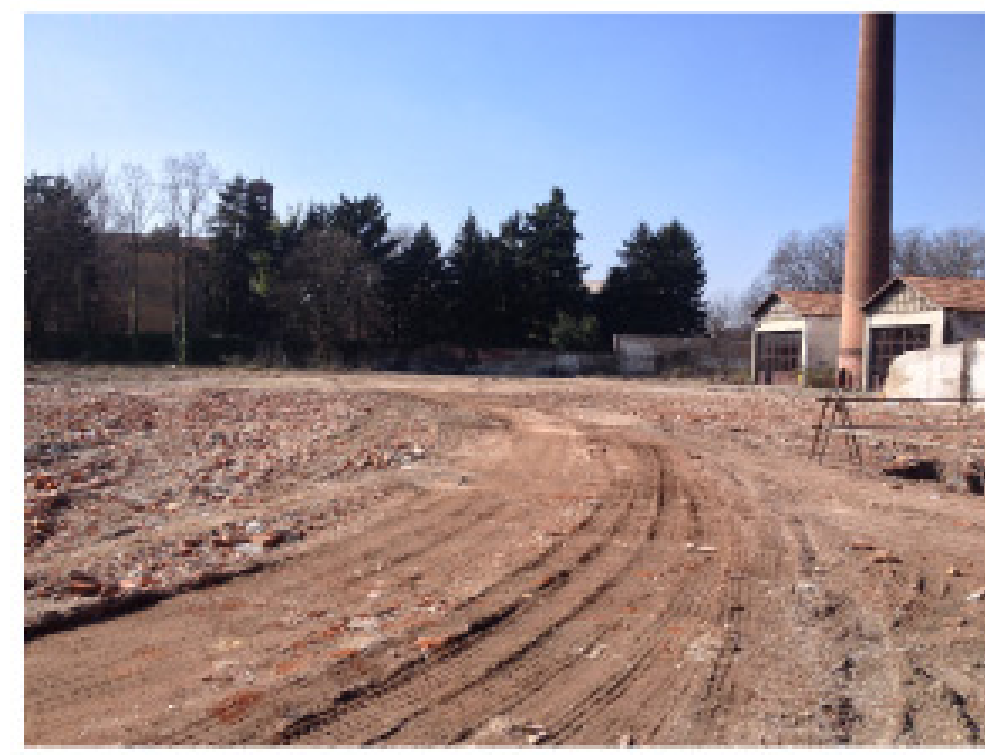
23. vista dall'interno: da est a ovest