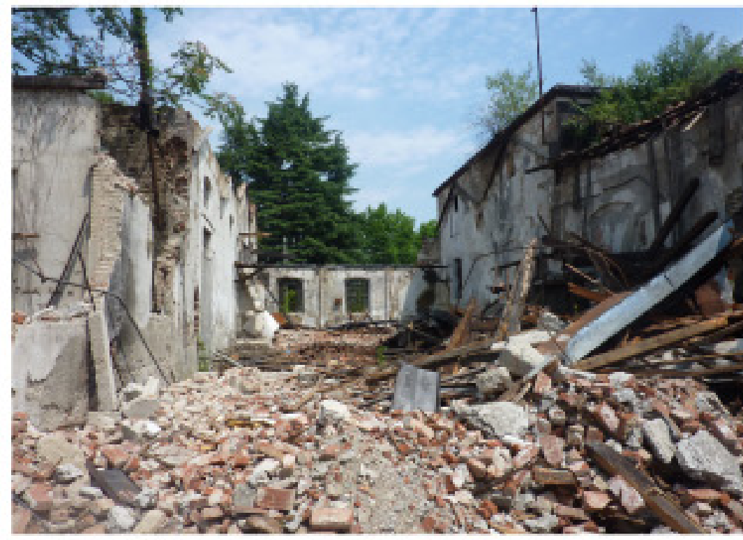
4. Viale Cesare Battisti Villa azzurra