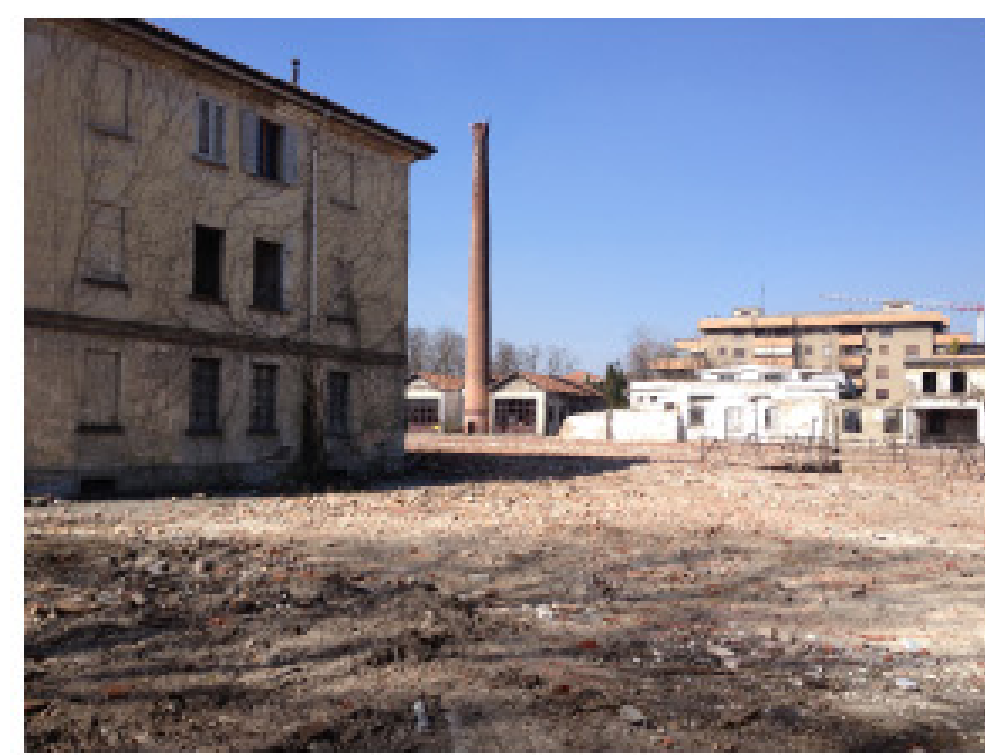
19. vista dall'interno: villa Azzurra, ciminiera ed edifici a nord