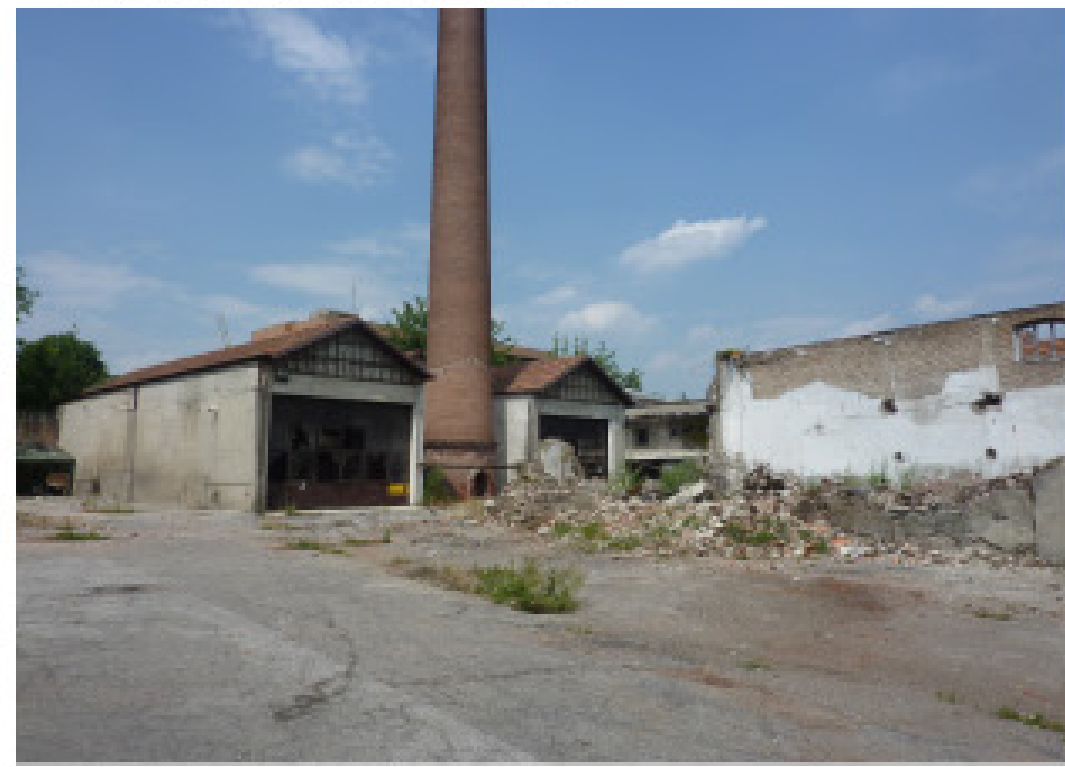
12. via Scarlatti confine nord