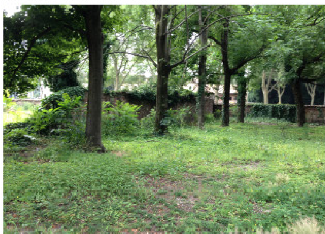
13. via Scarlatti confine nord