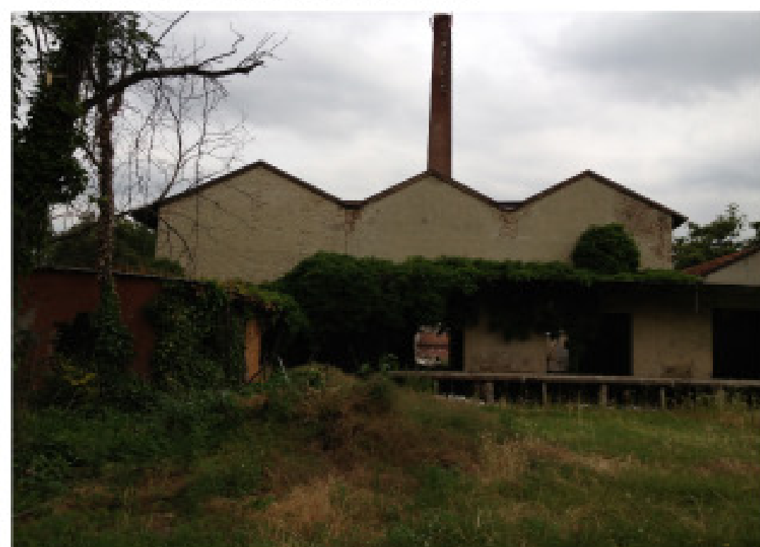
15. vista dall'interno: muro di cinta ovest