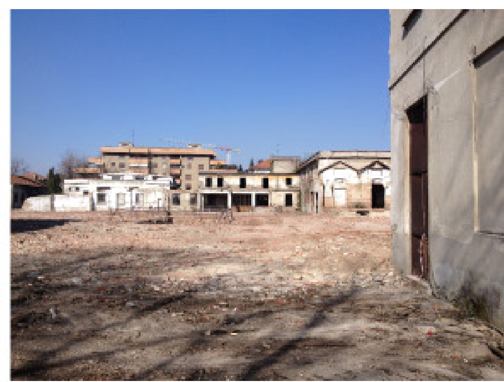
17. vista dall'interno: da sud a nord