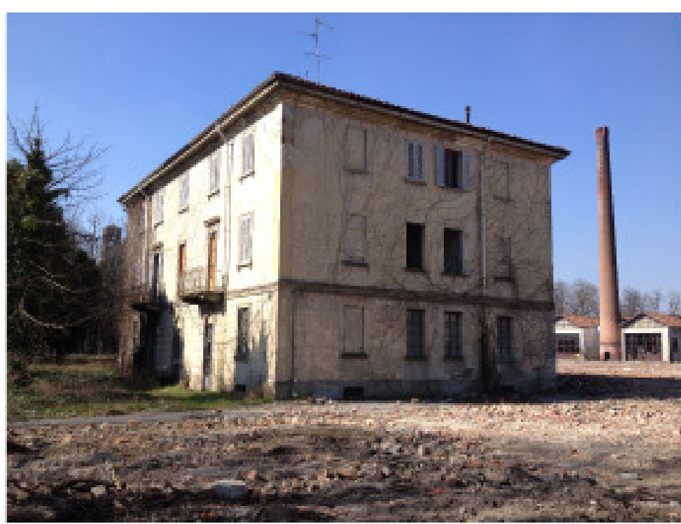
18. vista dall'interno: villa Azzurra e ciminiera