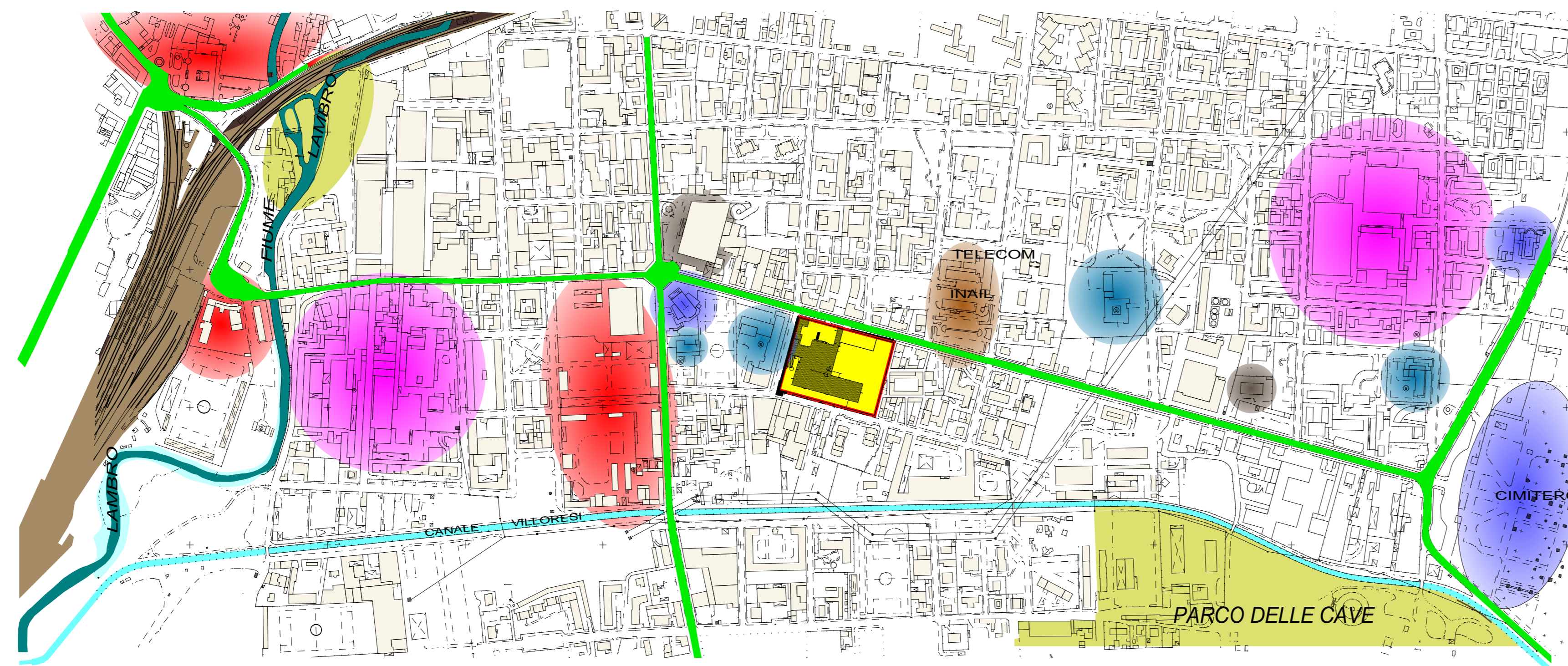
STATO DI FATTO - PLANIMETRIA ANALISI DEI PUNTI NOTEVOLI - scala 1:5000