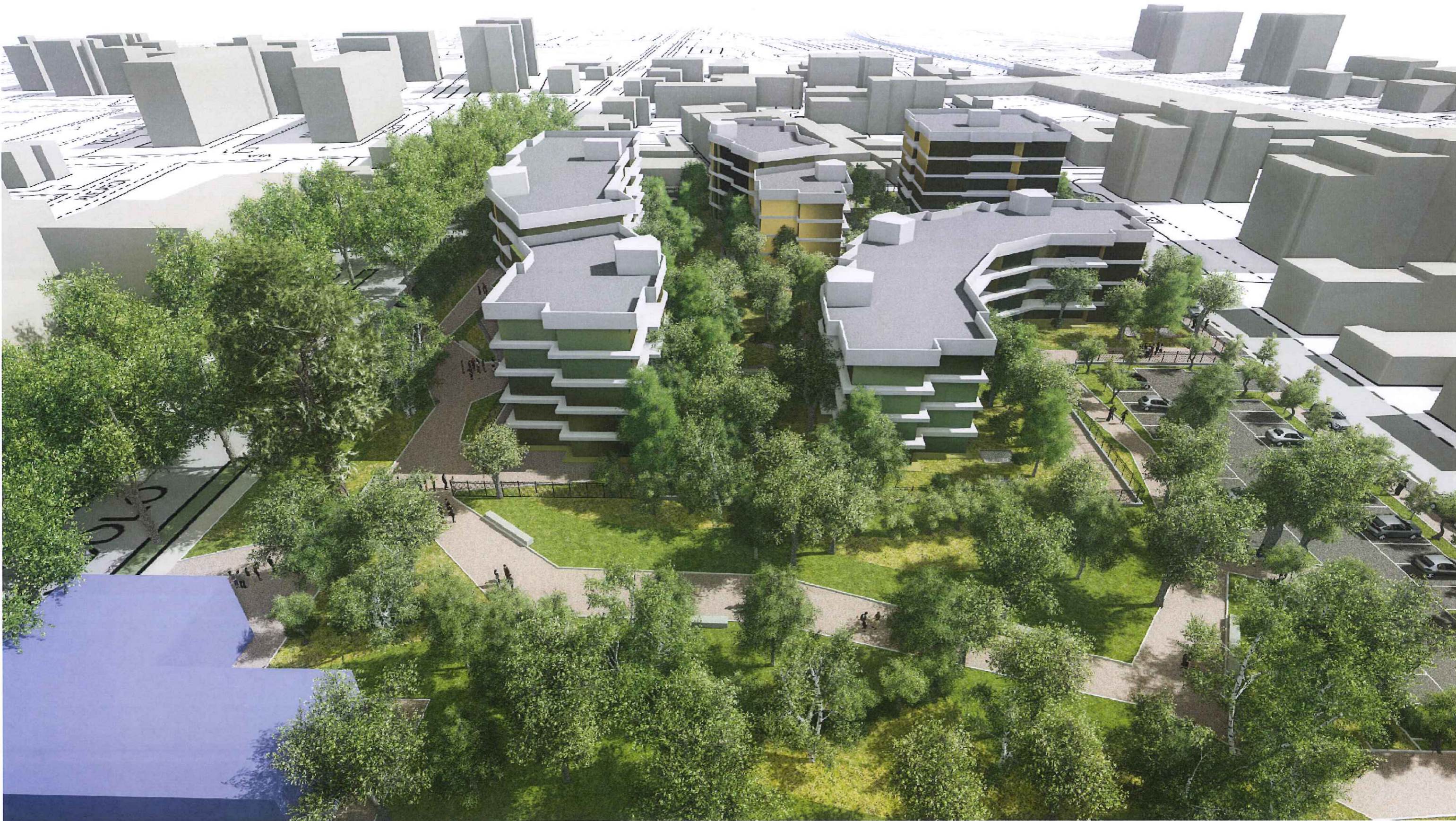
P.I.I. MONZA - VIALE U. FOSCOLO - VISUALIZZAZIONE PROSPETTICA PROGETTO