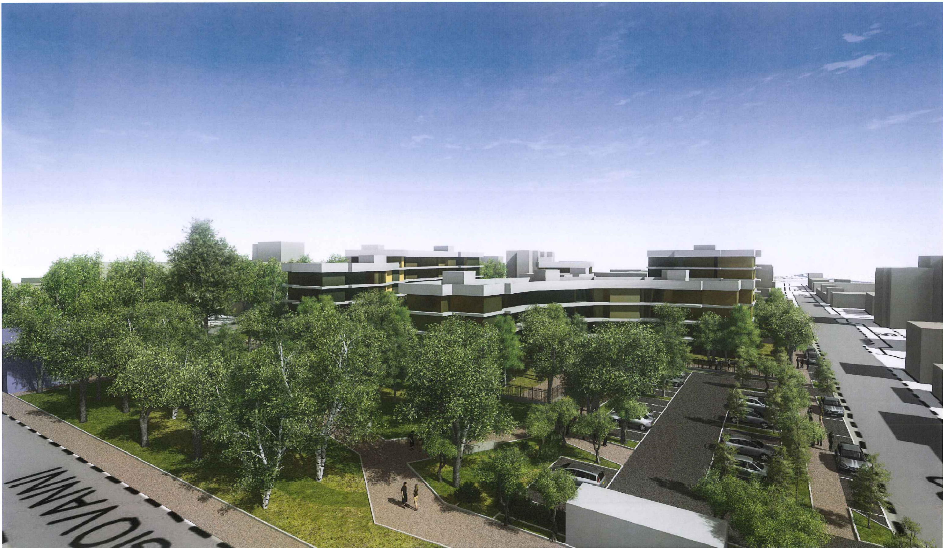
P.I.I. MONZA - VIALE U. FOSCOLO - VISUALIZZAZIONE PROSPETTICA PROGETTO