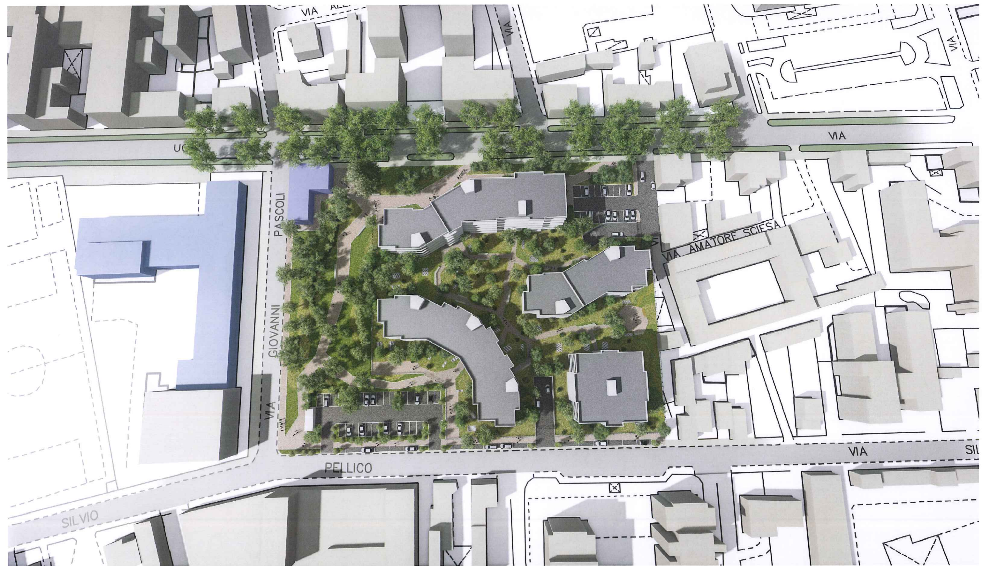
P.I.I. MONZA - VIALE U. FOSCOLO - VISUALIZZAZIONE PROSPETTICA PROGETTO