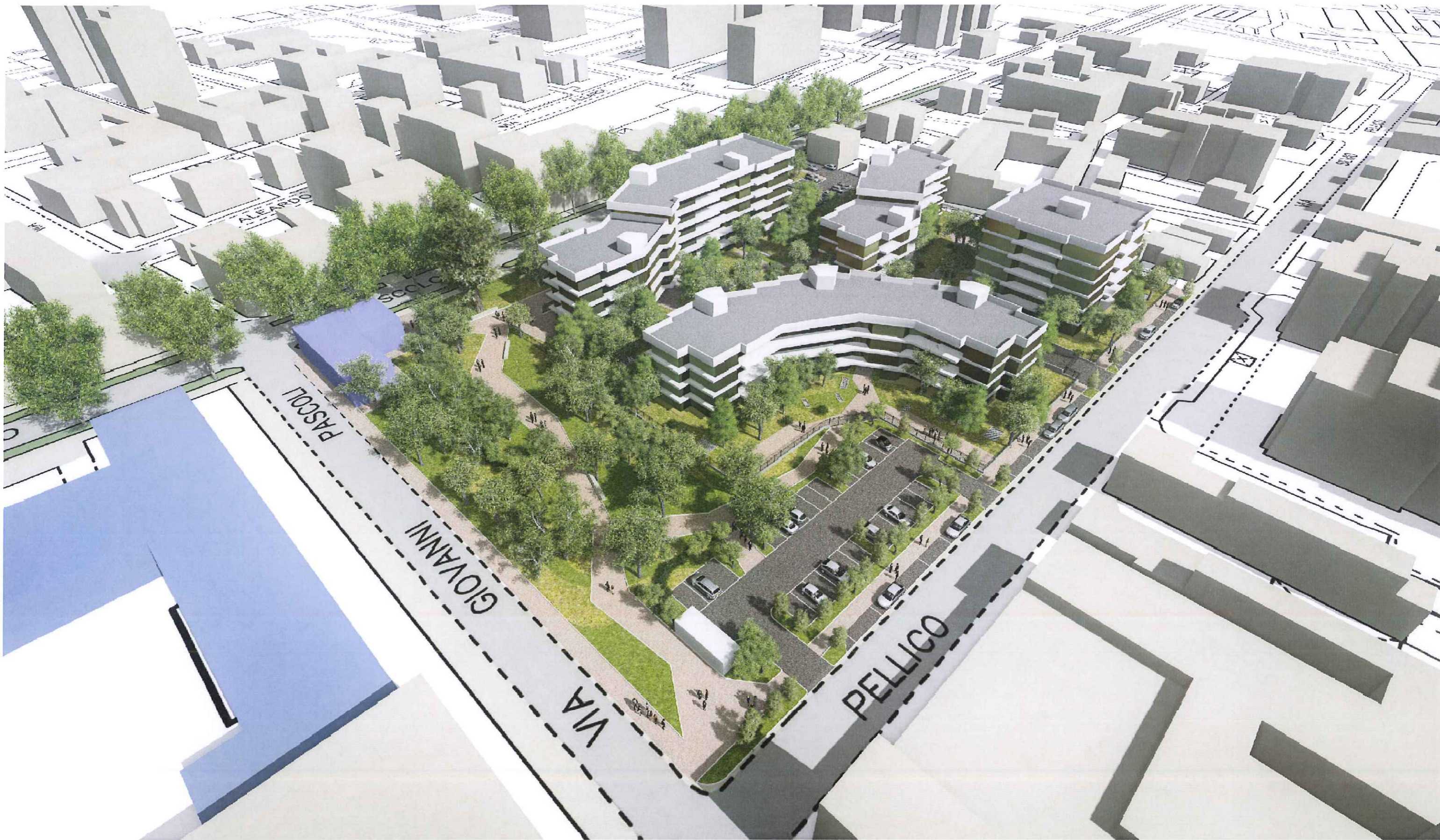
P.I.I. MONZA - VIALE U. FOSCOLO - VISUALIZZAZIONE PROSPETTICA PROGETTO