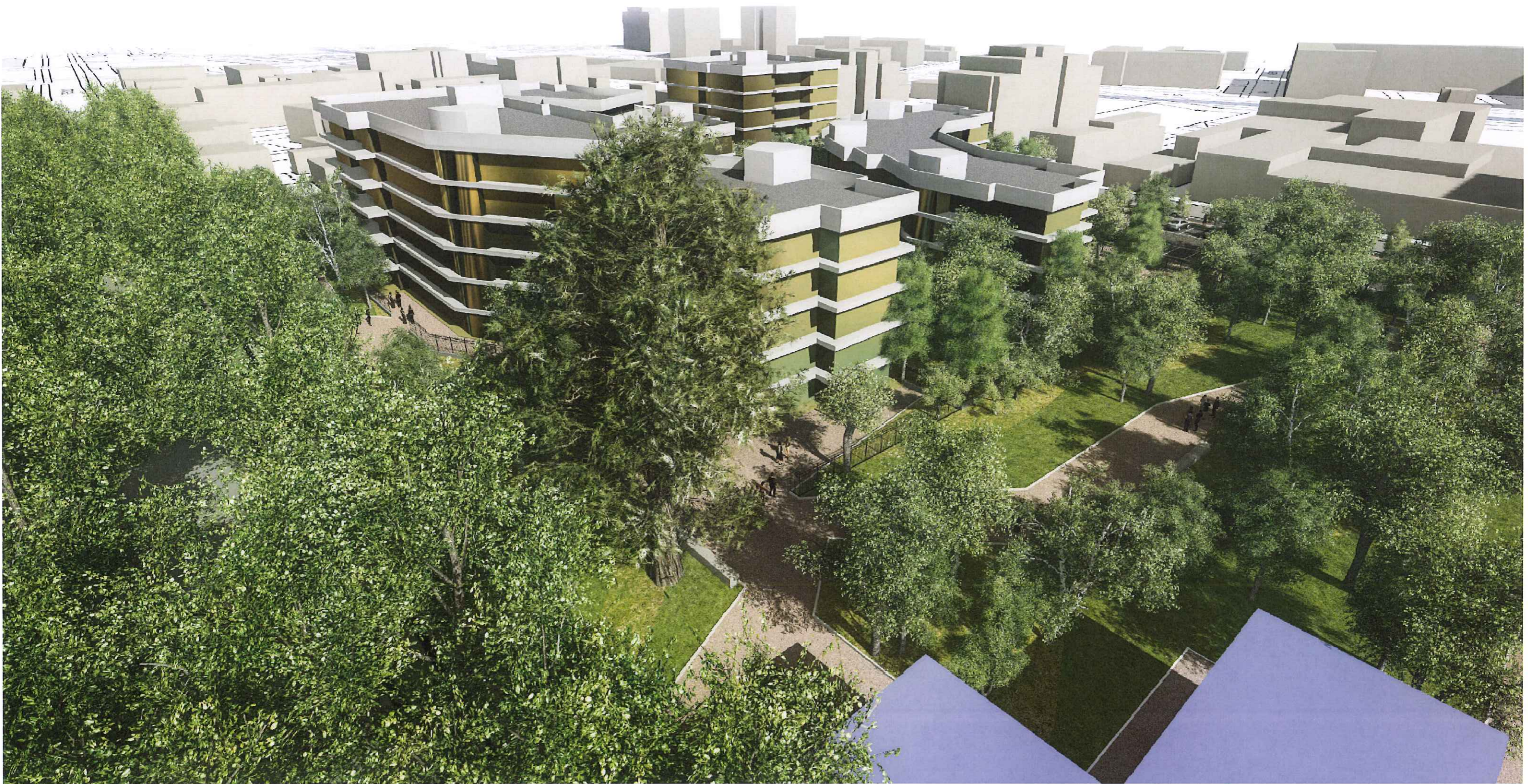
P.I.I. MONZA - VIALE U. FOSCOLO - VISUALIZZAZIONE PROSPETTICA PROGETTO