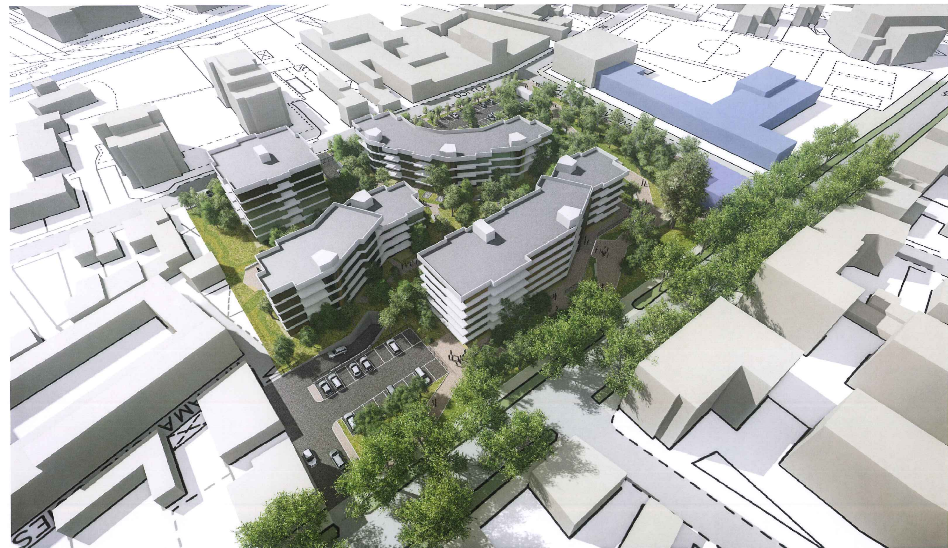
P.I.I. MONZA - VIALE U. FOSCOLO - VISUALIZZAZIONE PROSPETTICA PROGETTO