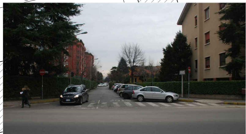
Vista all'imbocco di via Chopin