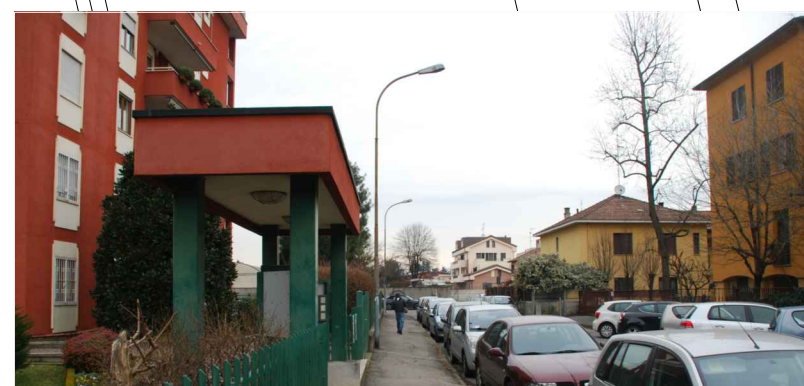
Vista a metà via Chopin verso area intervento