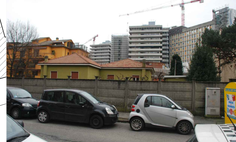
Vista a metà via Chopin verso Ospedale