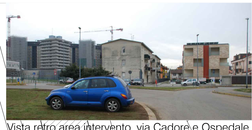
Vista retro area intervento_via Cadore e Ospedale