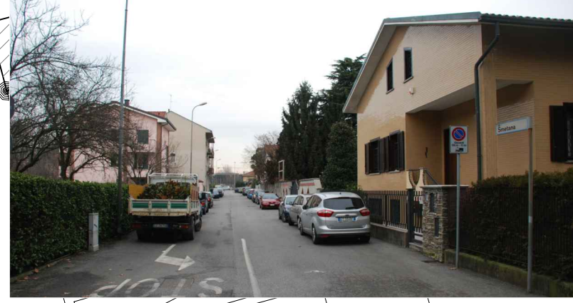
Vista da via Mascagni verso via Smetana