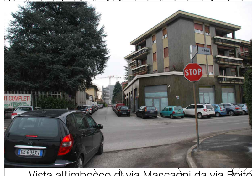
Vista all'imbocco di via Mascagni da via Boito