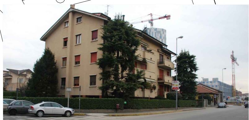
Vista via Chopin - via Pergolesi verso Ospedale