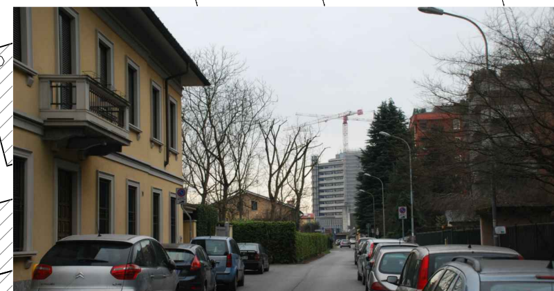
Vista di via Mascagni da via Boito