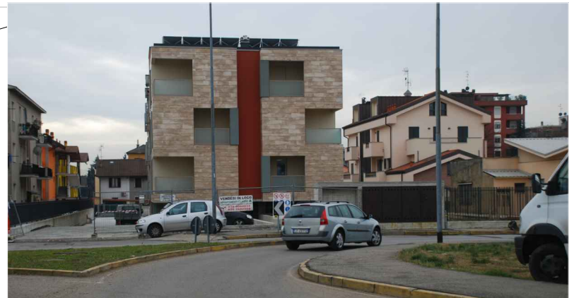
Vista retro area intervento_via Cadore