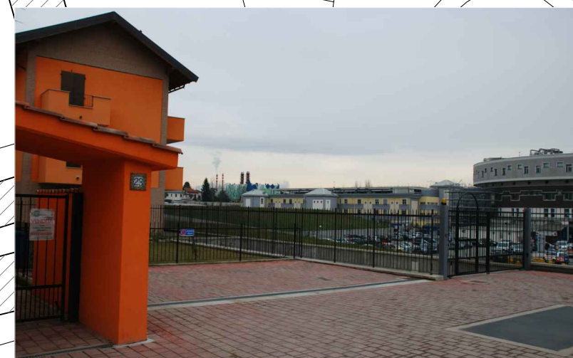
Vista ad est area intervento_Ospedale