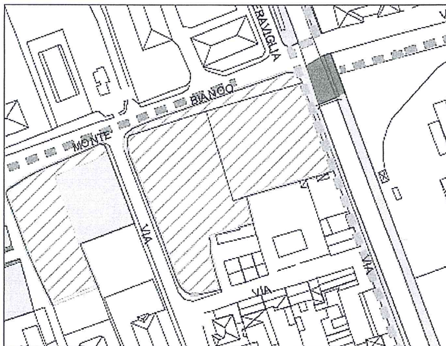
Estratto dalla tavola PS 02b del nuovo Piano dei Servizi

Non solo. Nel nuovo PGT quest' area risulta classificata nel Piano dei Servizi come "Area a verde destinata alla conservazione e rigenerazione del suolo" – Area V (art. 10 delle Nda del Pds) e con la previsione di un tracciato ciclopedonale del Biciplan (percorso a lungo termine) sulla via Monte Bianco. Anche nel Documento di Piano della proposta del nuovo PGT l'area in questione rientra nella Rete della urbanità e naturalità diffusa (tav. DP.02b - art. 12 delle sue Nda) con destinazione mista (Orti, Superfici drenanti e patrimonio vegetazionale).