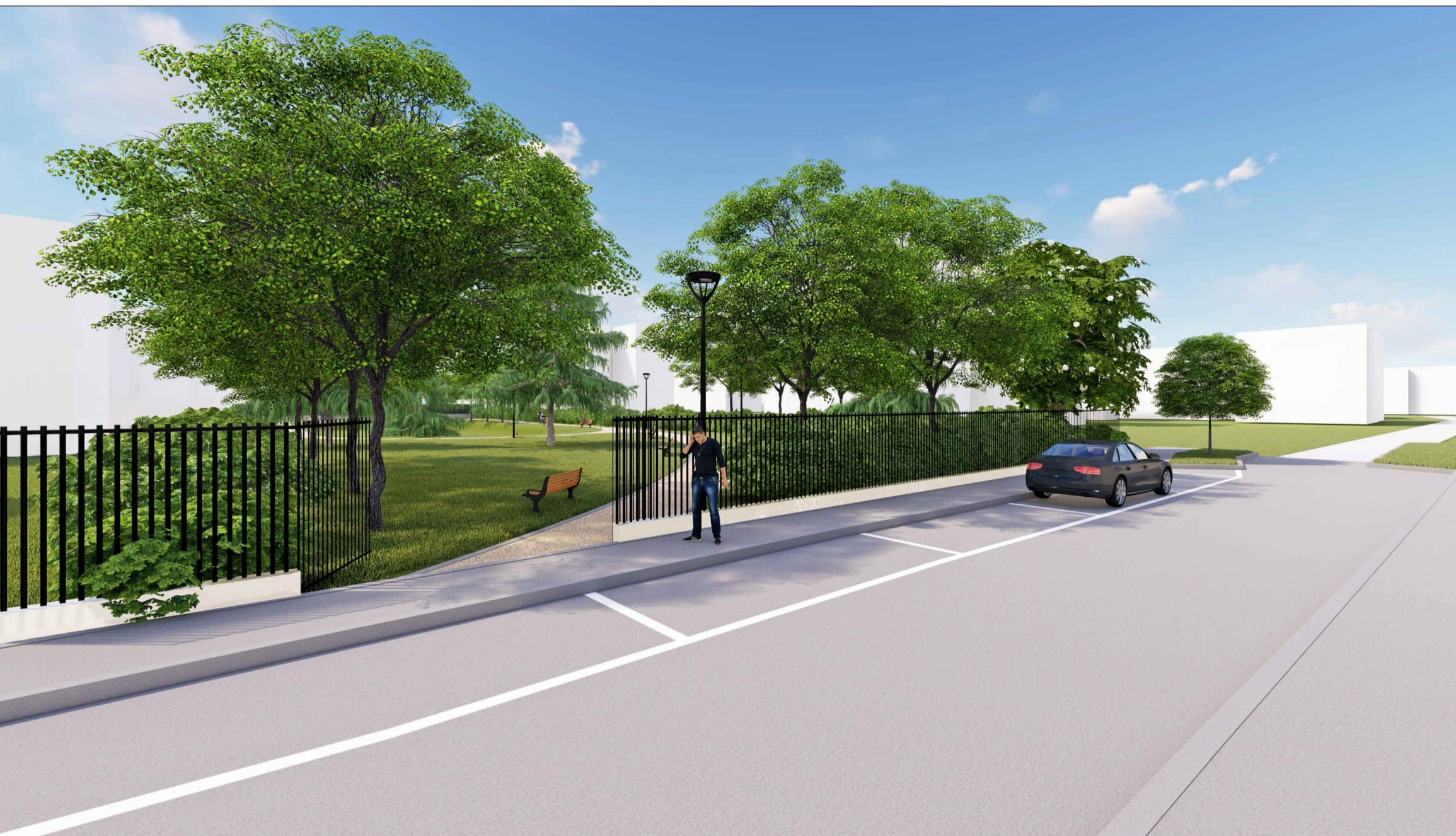
VISTA 3D 2