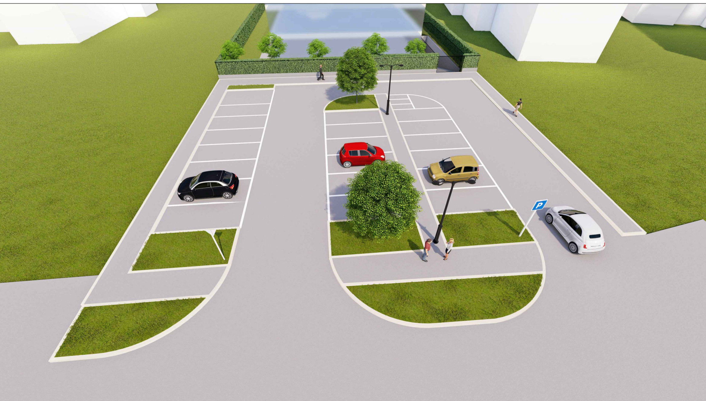
VISTA 3D 5