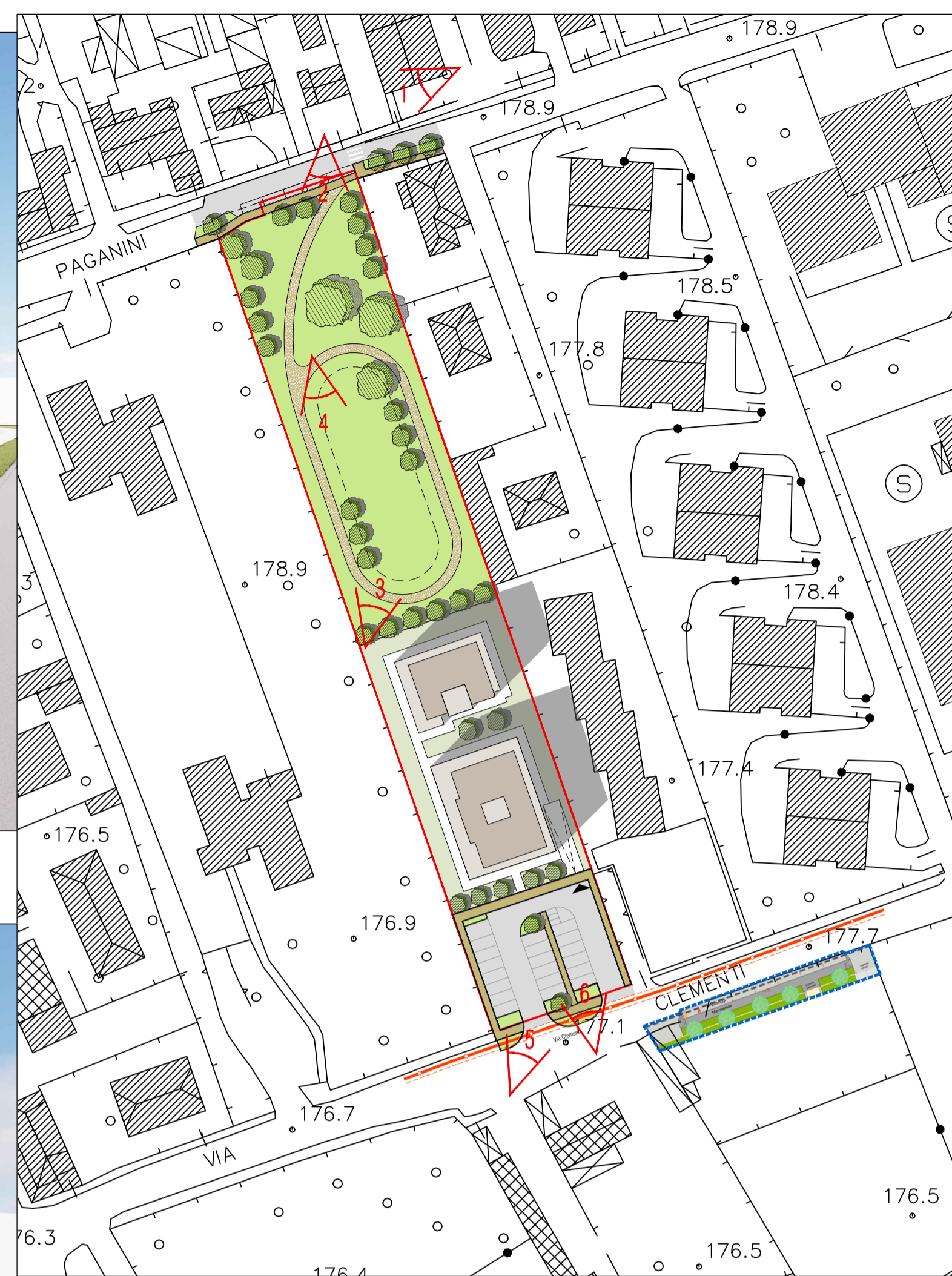
PLANIVOLUMETRIA - SCALA 1:1.000