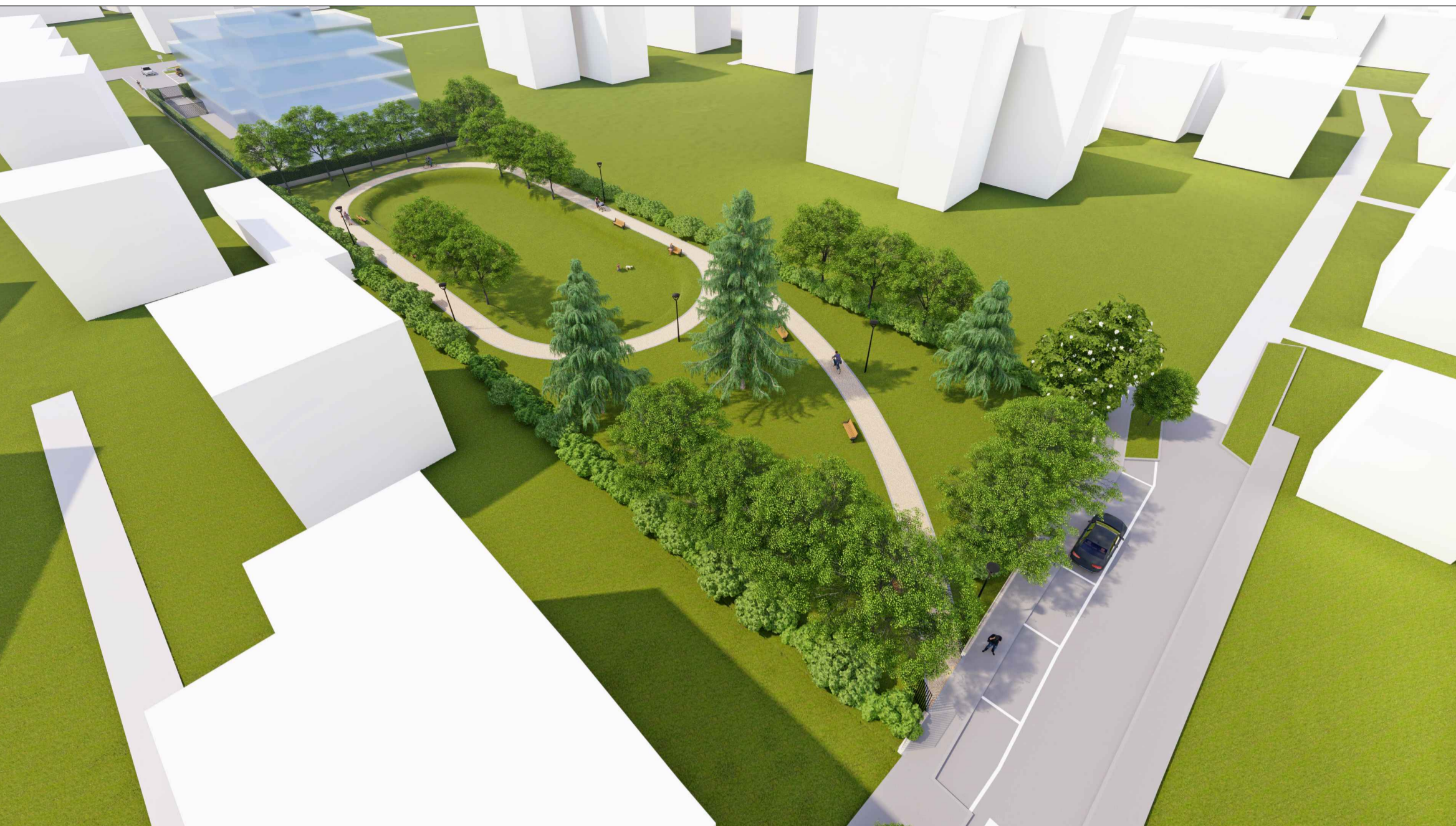
VISTA 3D 1