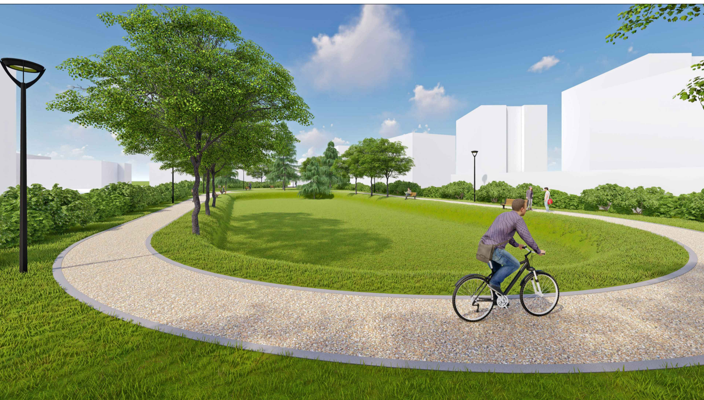
VISTA 3D 3