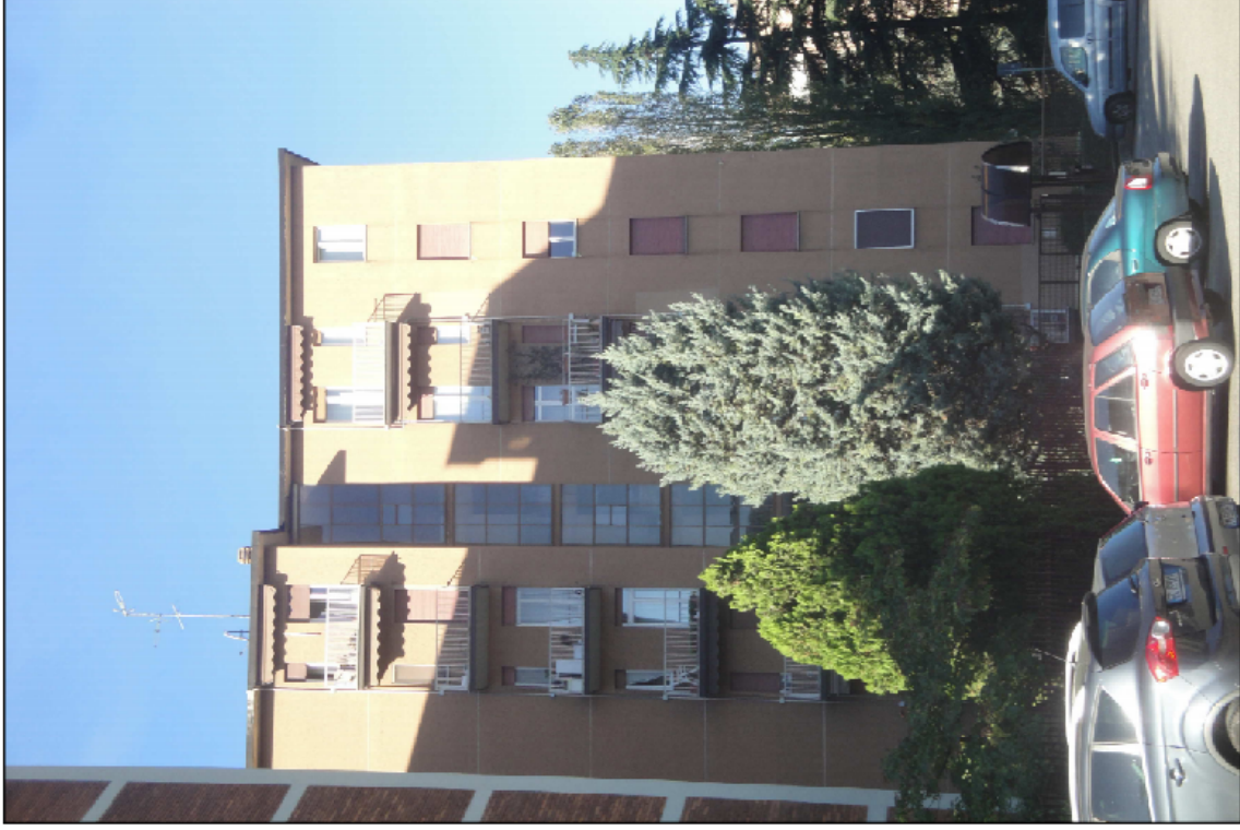
PUNTO DI VISTA N° 7