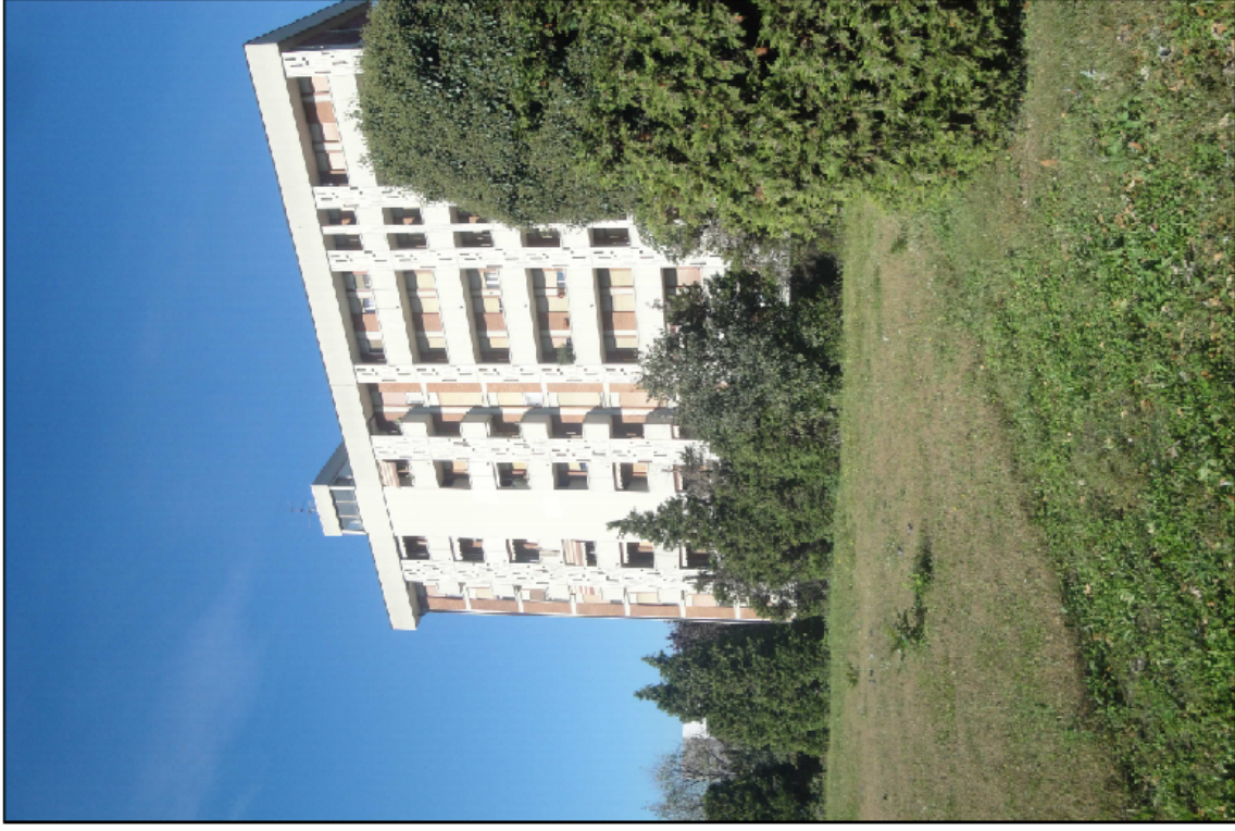
PUNTO DI VISTA N° 8