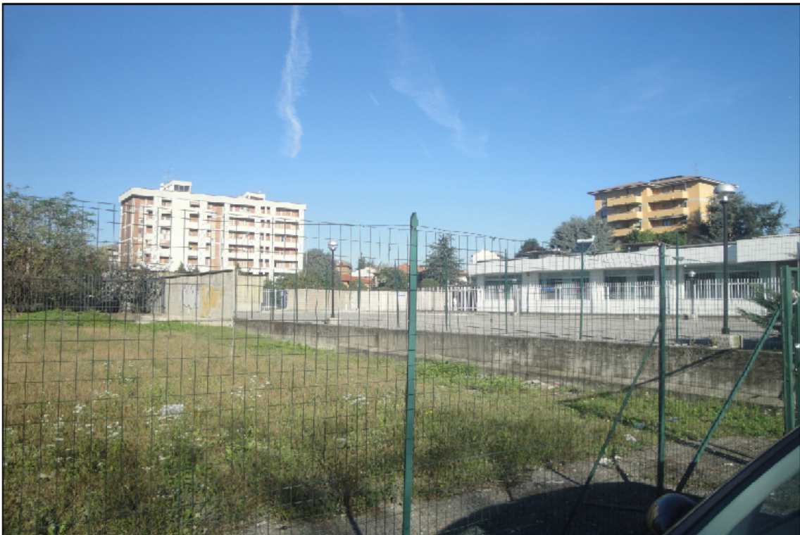
PUNTO DI VISTA N° 2