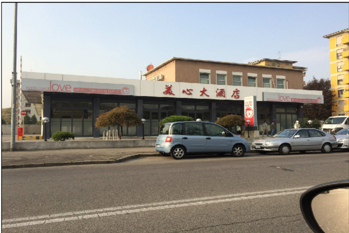
PUNTO DI VISTA N° 4