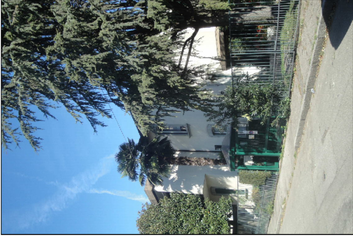
PUNTO DI VISTA N° 6