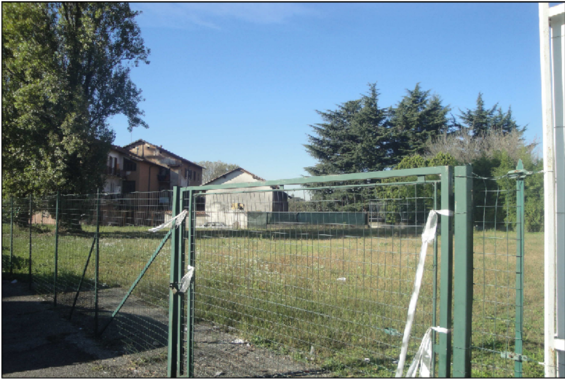
PUNTO DI VISTA N° 1