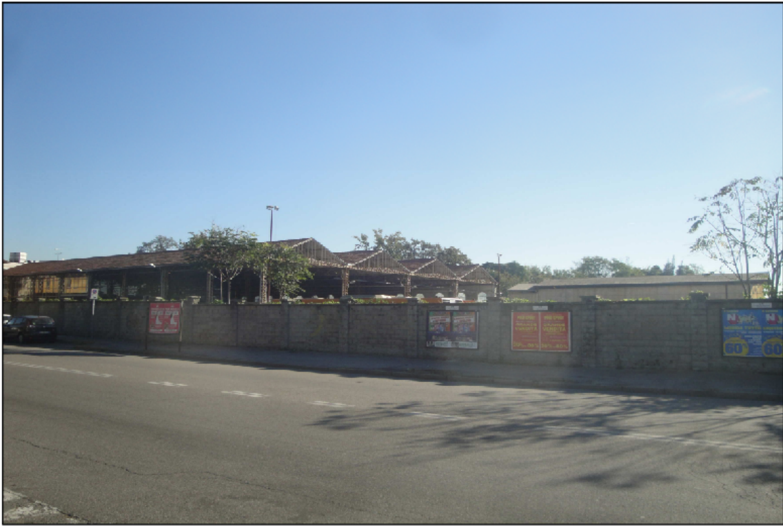
PUNTO DI VISTA N° 9