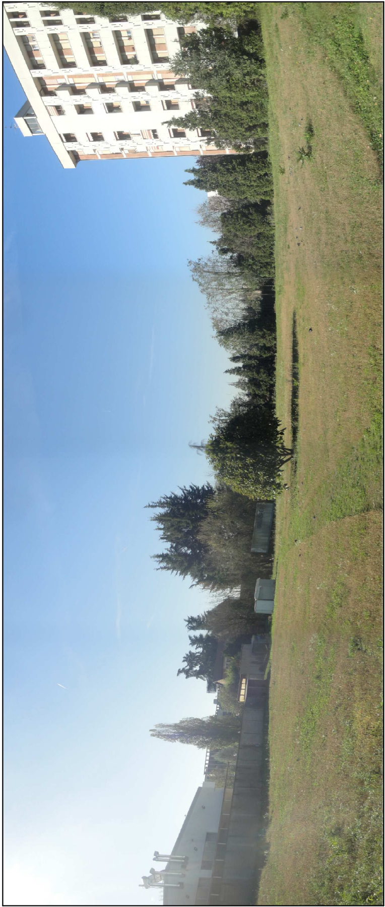
PUNTO DI VISTA N° 10