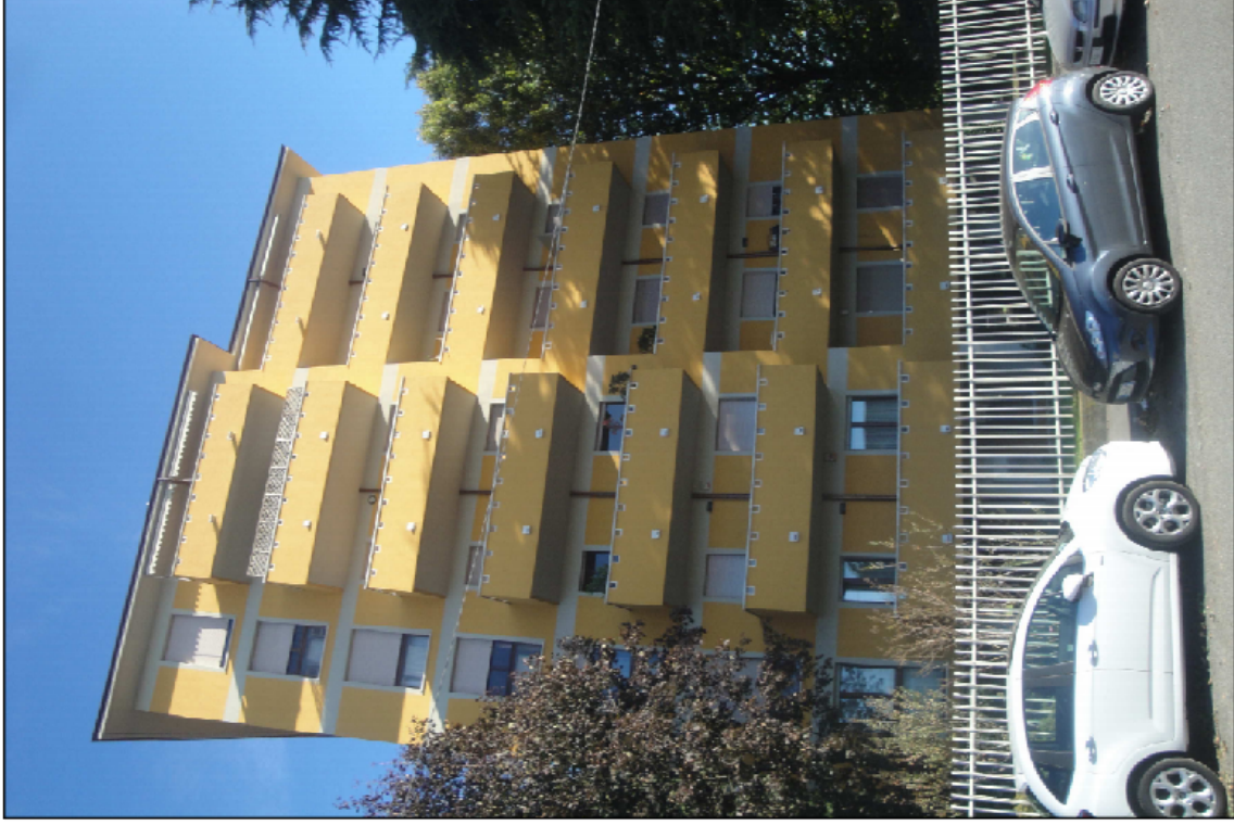
PUNTO DI VISTA N° 5