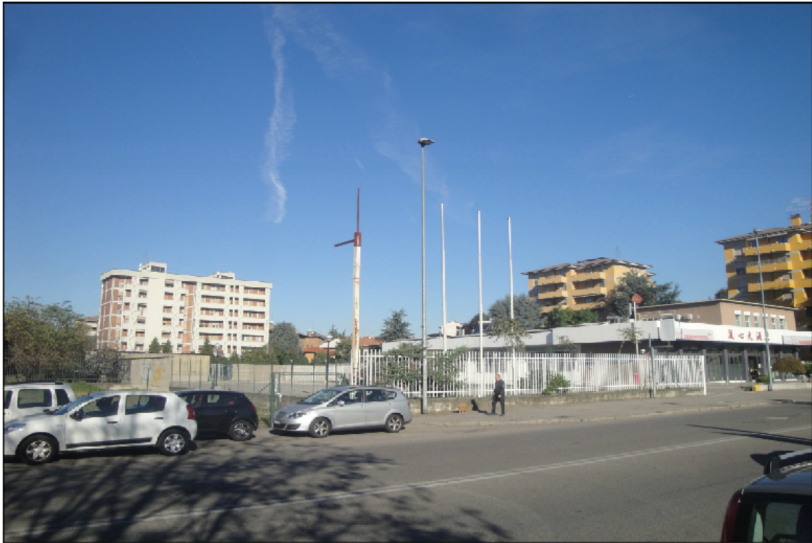
PUNTO DI VISTA N° 3