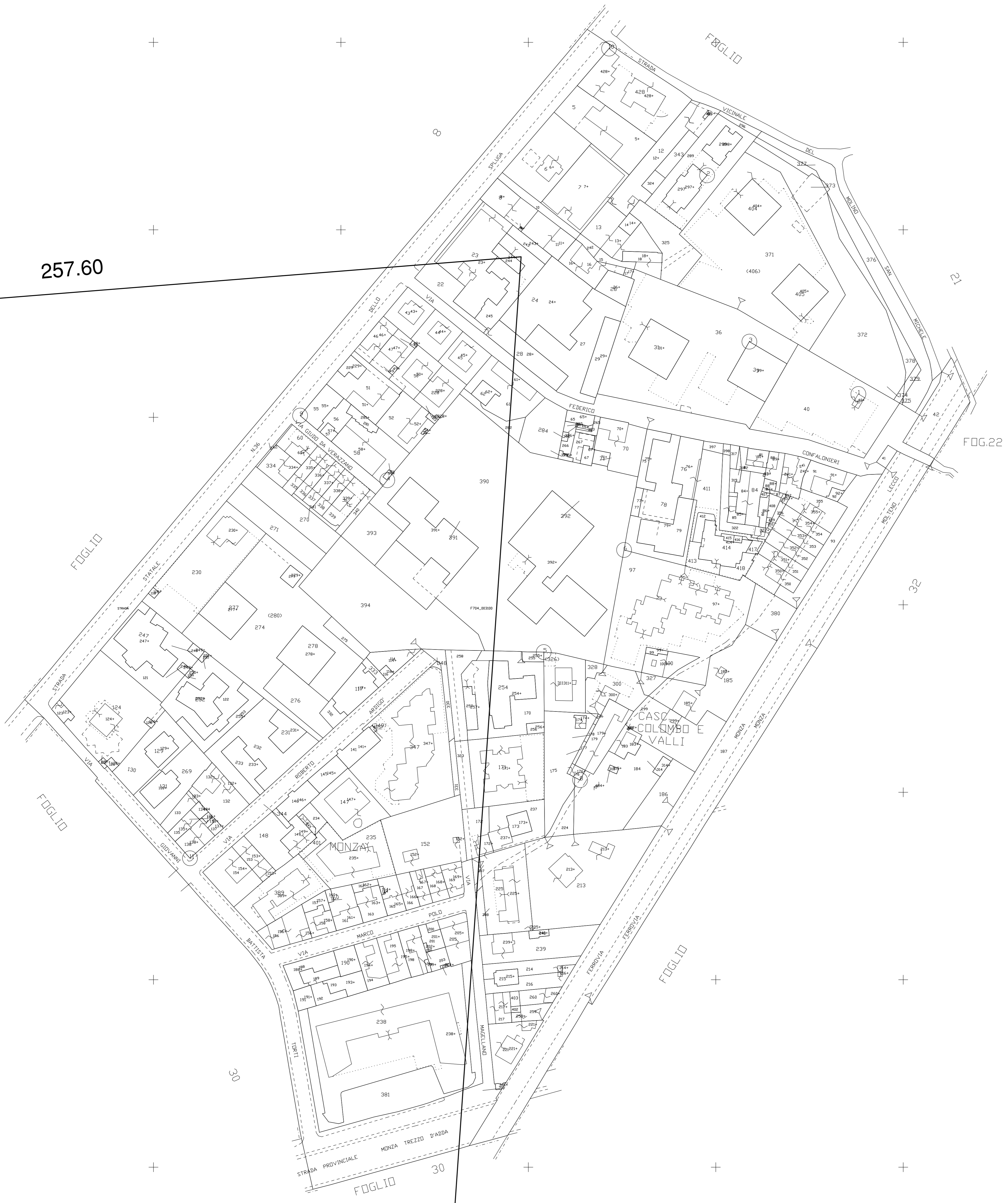
QUADRO D'UNIONE COMUNE