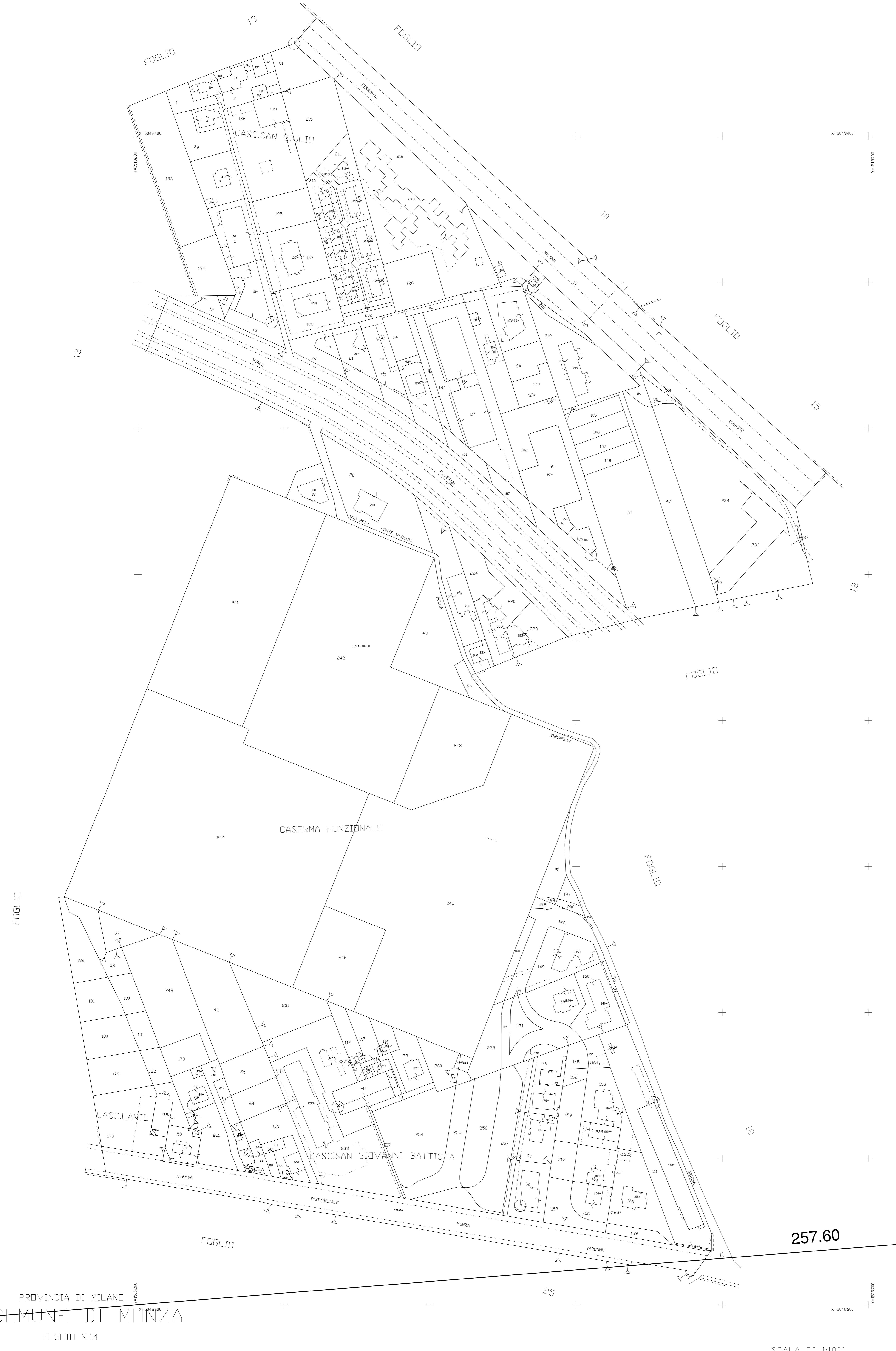
QUADRO D'UNIONE COMUNE