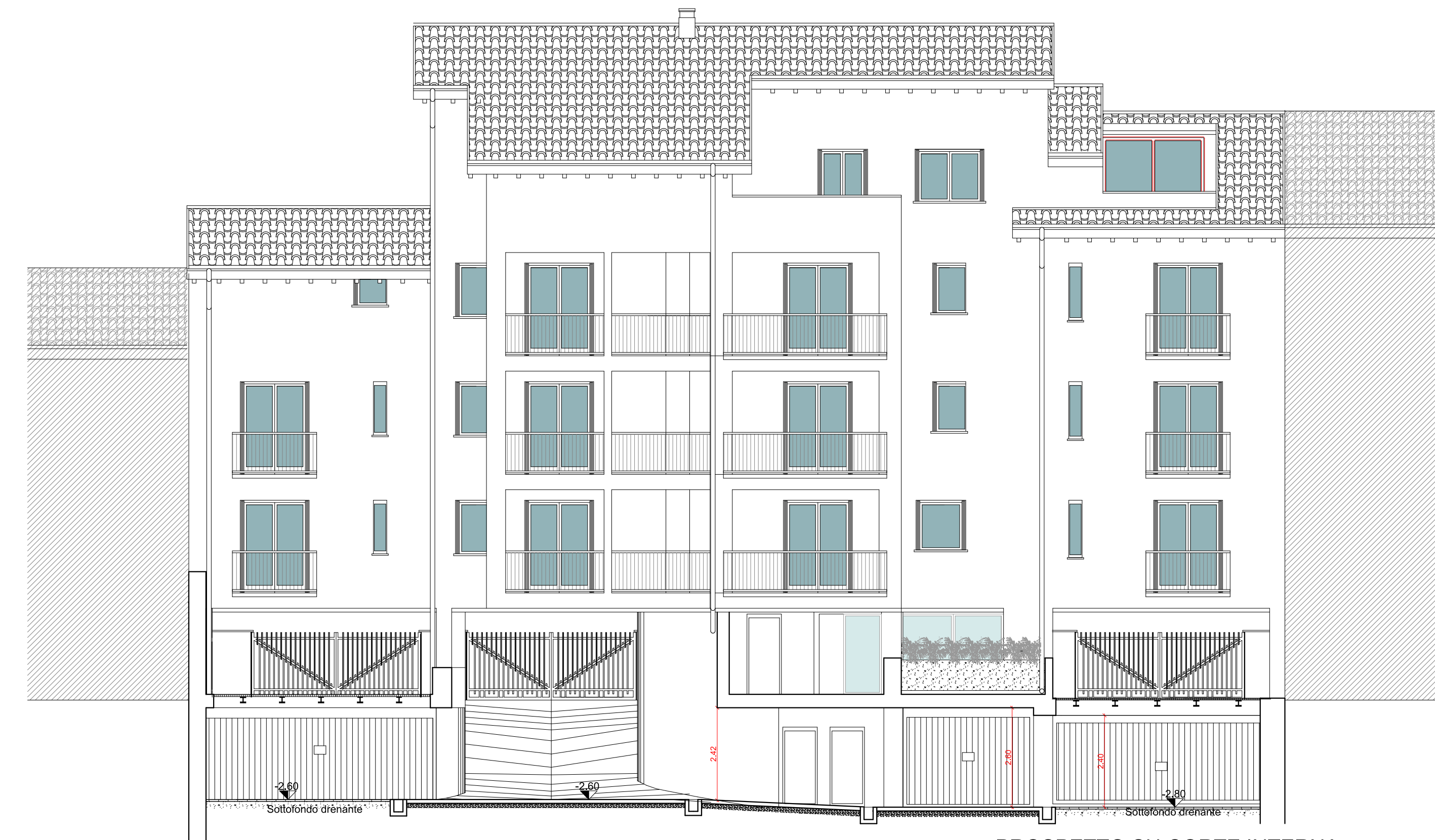
PROSPETTO SU CORTE INTERNA + SEZIONE E-E (SU PIANI PIANI TERRA E INTERRATO)